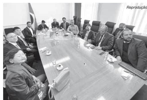
Tecnologia desenvolvida em Minas Gerais em parceria com empresa chinesa ajudará mineradoras a agilizar o fim das barragens à montante

O governador Romeu Zema afirmou que a iniciativa é de fundamental importância para o estado de Minas Gerais e terá apoio e suporte ativo do Governo do Estado. "No meu primeiro mês de governo enfrentei a tragédia de Brumadinho, e um dos meus primeiros compromissos