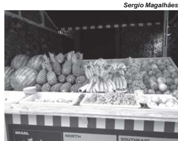
A banca de frutas, novidade deste ano que agradou a todos no paddock de Interlagos

Interlagos estava muito diferente este ano, e para melhor, diga-se. Muitas melhorias foram feitas ainda para o The Town, o festival de música realizado em setembro. A área do estacionamento interno do autódromo ganhou asfalto e grama artificial onde antes virava lamaçal em dias de chuva. Na sala de imprensa, entre lanchinhos, variedades de bolos e até canja foram servidos aos jornalistas e fotógrafos, mas o grande barato gastronômico estava no paddock (área atrás dos boxes) onde pela primeira foi