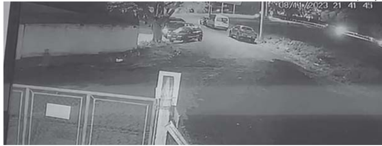
Câmera de segurança registrou momento em que a vítima (no canto inferior esquerdo) caminha enquanto os ladrões levam seu veículo

Imagens de uma câmera de segurança mostram que, por volta das 21h40, a vítima caminhava pela avenida José Pio em direção ao seu