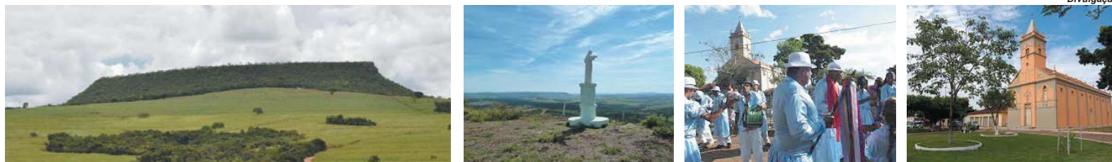
Detalhes como festas, cultura, religião, turismo e o cotidiano no distrito de Guardinha foram utilizados para trabalho com os estudantes

A história contada de uma maneira muito particular. Assim pode ser definido o trabalho realizado pelos alunos da Escola Municipal Francisco Daniel, do distrito de Guardinha. A atividade é uma espécie de documentário noticioso, pois registra os fatos e informa sobre a vida e a realidade de pessoas da comunidade.