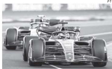
Primeira sprint do ano será hoje, em Imola, palco do GP da Emilia Romagna

A diferença é que agora os oito primeiros colocados pontuam. O primeiro leva 8 pontos, o segundo 7, o terceiro 6 e assim sucessi-