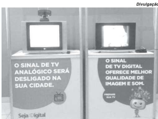
Sinal digital com mais qualidade e conteúdo estará disponível na região no próximo ano

As prefeituras de Minas Gerais que solicitarem adesão ao Digitaliza Brasil e forem qualificadas receberão os equipamentos para a digitalização do sinal de TV. A infraestrutura entregue será compartilhada pelo município e por emissoras de televisão autorizadas a transmitir em formato digital. Com isso, cidades que hoje têm apenas um canal de TV poderão ter até oito canais digitais.