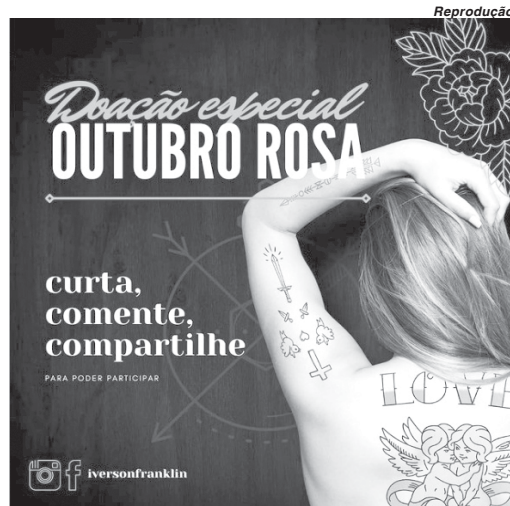
Promoção realizada no Instagram premiará a participação que tiver mais curtidas

A proposta de fazer a doação surgiu com o Outubro Rosa, conhecido como de conscientização sobre a enfermidade. "Sei que meu trabalho é amenizar a perda e devolver a autoestima para o paciente,