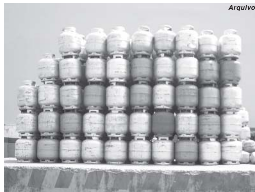
Vale a pena pesquisar os preços do gás de cozinha em Paraíso, a diferença a mais chega a ser de R$10,00 por botijão de 13 quilos

Então, com este enorme desemprego no País, queda na renda de quem está trabalhando, juntamente com este flagelo da pandemia do Covid-19 que ceifou a vida de mais 250 mil brasileiros, a Petrobrás e alguns comerciantes do ramo de vendas de combustíveis e do gás