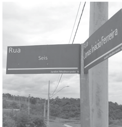
A Rua Seis onde faz entroncamento com a rua Jonas Inácio Ferreira, no Jardim Mediterrâneo II, a Prefeitura não atualizou o nome, esta rua chama-se, Professora Maria Abadia da Silva

Vale frisar que em vias públicas sem a as placas com as devidas nomenclaturas, existem moradores ansiosos para que este sério problema seja o mais breve possível resolvido.