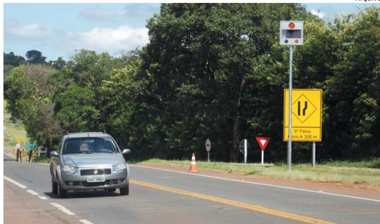
Nos últimos anos radares foram instalados nos acessos e entorno da cidade, como na BR-265

O Departamento de Edificações e Estradas de Rodagem de Minas Gerais (DER-MG) lançou edital de licitação, na modalidade pregão eletrônico, para escolha da empresa que vai operar o sistema de monitoramento de 995 radares nas rodovias do estado. O aviso foi publicado no Diário Oficial do último dia 13 de fevereiro. A região de São Sebastião do Paraíso deverá ser uma das áreas que deverá receber parte dos novos equipamentos de fiscalização, como já vem ocorrendo nos últimos anos.