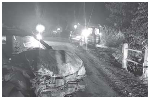
Passageira de caminhote ficou ferida em acidente na estrada de Guardinha