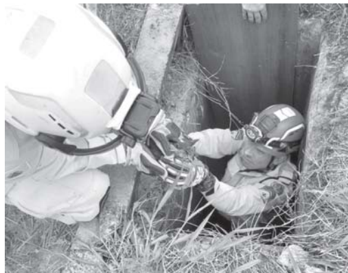
Gato foi resgatado de tubulação depois que militares usaram irmão do filhote para atraí-lo