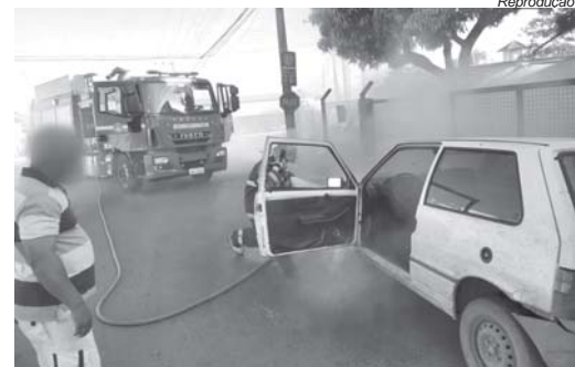
Fiat Uno pegou fogo e bombeiros foram acionados para conter as chamas no veículo