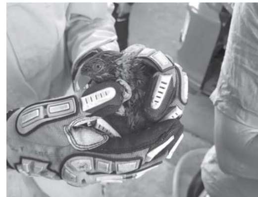
Periquito-arco-íris foi salvo depois de escapar e parar na copa de uma árvore de mais de seis metros