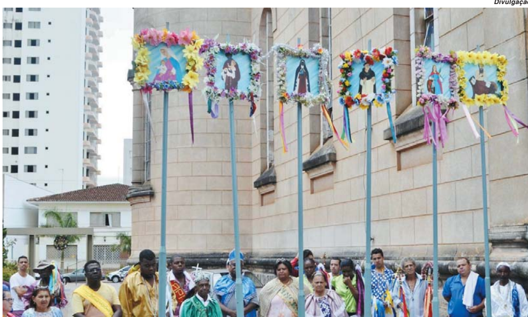
Solenidade de levantamento das bandeiras marca o início das Congadas em 2018 em Paraíso

Os preparativos foram iniciados há cerca de três meses, com várias reuniões envolvendo os dirigentes dos ternos de Congo e Moçambique, membros da comissão organizadora e representantes da administração municipal. Os encontros ocorreram para tratar das regras, regulamento e outras atividades referentes aos desfiles. “São muitos os detalhes que são debatidos, são necessárias decisões, mas para cada si-