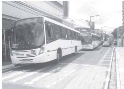
Talma Transportes fará o transporte coletivo na cidade até 31 de dezembro, Município busca alternativa

A Prefeitura de São Sebastião do Paraíso abriu licitação para contratar uma empresa especializada em prestação de serviço de locação de frota de ônibus. A medida visa atender a comunidade a partir de 1º de janeiro de 2022 com término do contrato emergencial com a Talma Transportes termina no final de 2021. O objetivo segundo o prefeito Marcelo Moraes é evitar despesas como o pagamento de subsídios mensais na casa de R$ 65 mil como ocorreu em novembro e dezembro, condição pedida para que o transporte da população não fosse interrompido.