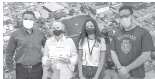
Cerca de 260 alunos de nove escolas do Município participaram do concurso

cola e a cada dia estamos aprendendo ainda mais", finaliza.