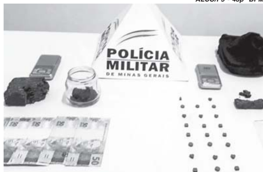
Material entorpecente foi apreendido junto com balança de precisão e dinheiro

Uma abordagem policial resultou na prisão em flagrante de dois homens em Itamogi, suspeitos de tráfico de drogas. A ocorrência foi registrada pela Polícia Militar que encontrou de posse e também nas respectivas residências dos envolvidos, materiais entorpecentes e outros produtos utilizados para a prática delituosa.