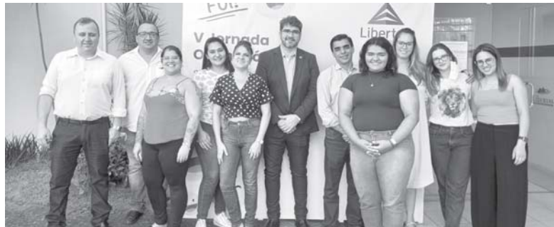
Alunos de Odonto, coordenador e presidente CRO

O Conselho Regional de Odontologia de Minas Gerais - CRO/MG em parceria com a Libertas - Faculdades Integradas, realizou a V Jornada Odontológica com apoio da Prefeitura de São Sebastião do Paraíso, sexta-feira (26/11) e sábado (27/11). O evento contou com a participação da primeira turma do Curso de Odontologia da Libertas e com profissionais da área da saúde de Paraíso e região.