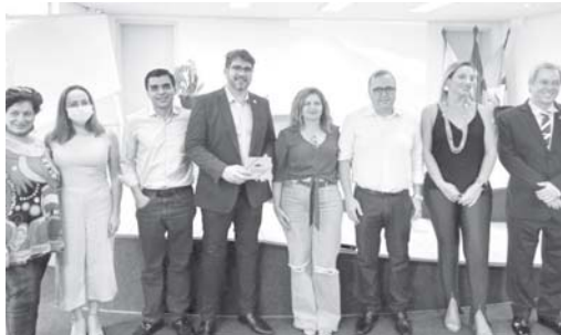
Organizadores e palestrantes