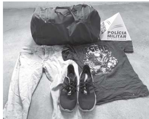
Roupa usada pelo suspeito durante a fuga

O sepultamento ocorreu no Cemitério da Saudade às 10h30 de quinta-feira (7).