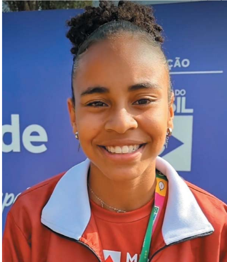
Aos 17 anos, atleta sonha em se profissionalizar no salto em distância e já busca equipes para o ano que vem

Motorista cai em golpe e perde R$ 1 mil em Paraíso