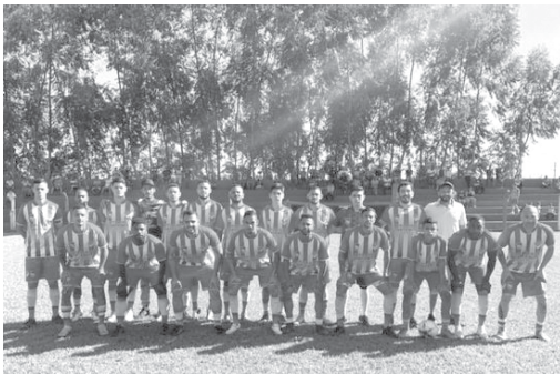
Operário aposta na força do grupo e tem feito bons jogos mesmo atuando fora de casa

A Liga Desportiva Serranense, organizadora do Campeonato Regional Amador definiu os jogos da segunda fase da competição que terá início neste domingo, 19. Cravinhos, Operário e Brodowski que tiveram as melhores campanhas na fase de grupo jogam fora de seus domínios e terão a vantagem de decidirem a vaga em casa na próxima rodada. Serão três jogos as partidas decisivas, de volta no próximo dia 26, quando sairão os quatro semifinalistas.