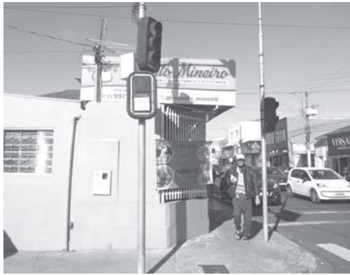
Os oito semáforos exclusivos para sinalização de pedestres no cruzamento da Av. Angelo Calafiori com Av. Delfim Moreira estão todos desativados