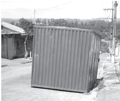
Caçamba colocada dentro do leito da Rua Bahia, bairro Mocoquinha, sem nenhuma sinalização refletiva