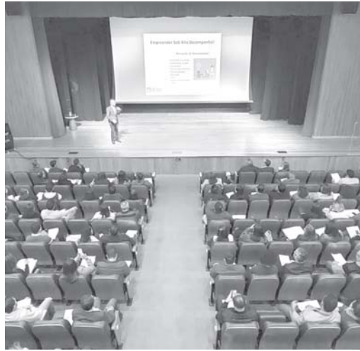
Palestra dia 14 sobre "Empreender sob alto desempenho"

sentado na sede da associação é que os alunos possam estudar à distância no modo EAD (Educação à Distância), facilitando que muitos possam terminar seus estudos nos ensinos fundamental e médio e assim alcancem