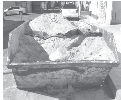
Caçamba colocada dentro do leito da Rua Bahia, bairro Mocoquinha, sem nenhuma sinalização refletiva

Em diversas vias públicas de Paraíso como se pode constatar numa colocada dentro do leito da Rua Bahia, bairro Mocoquinha, existem, caçambas sem nenhuma sinalização