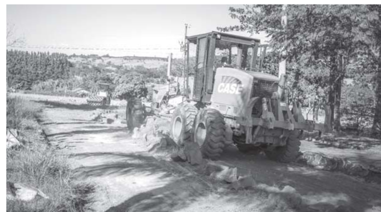
Máquinas iniciaram preparação das ruas, que receberão rede de drenagem e, posteriormente, calçamento

Também será executada a construção de 20 metros lineares de ramais com tubos de 400 mm na Av. Ferreira de Carvalho, construção de 01 caixa de passagem de águas pluviais e 40 metros lineares de ramais com tubos de 400 mm na confluência das avenidas dos Netos com a 15 de Novembro. E ainda, a construção de uma caixa de passagem de águas