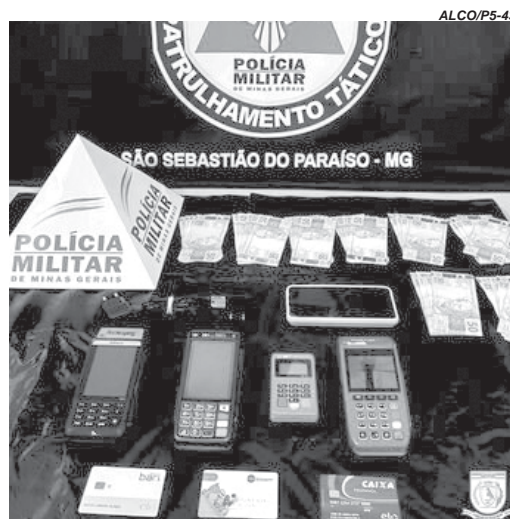
Com a estelionatária foram apreendidos cartões, máquinas e dinheiro que foram encaminhados para a delegacia junto com a acusada

Durante a visita a golpista anunciou a vítima que teria havido um erro com a conta bancária da idosa e que seria necessário fazer alterações. Para isso a idosa deveria en-