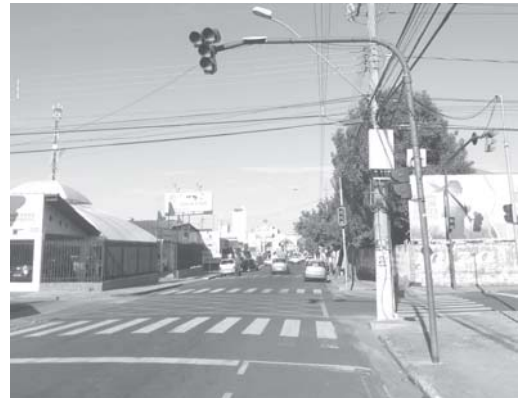
Todos os semáforos, para veículos e pedestres no cruzamento da Av. Mons. Mancini com Rua Prof. Nixon não funcionam

Fomos verificar ambas reclamações e constatamos que já passa de um mês que os oito sinais de trânsito para orientar a vez da passagem para pedestres estão todos desativados. Isso significa que naquele cruzamento que é um dos mais movimentados da cidade, tan-