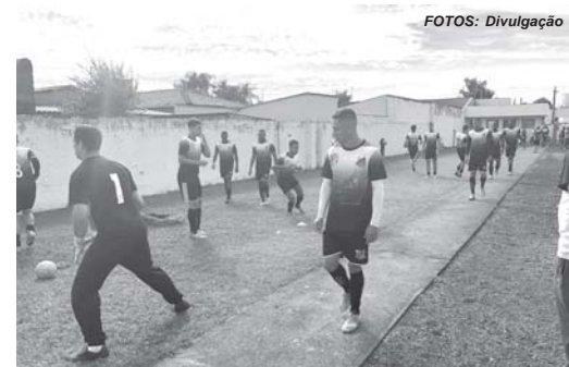
Com equipe reforçada São José venceu o América por 1 a 0 domingo passado