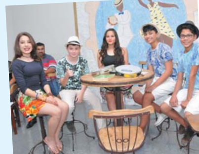
Música - Samba Patrimônio Cultural Imaterial do Brasil - 8º ano