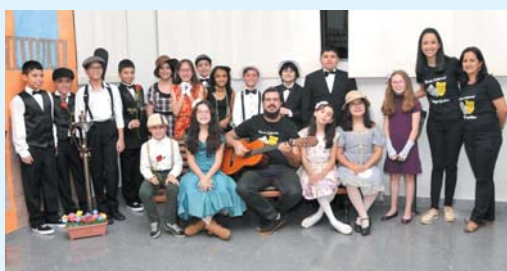
Música - A história da música de serestas - 5º ano