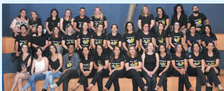
Equipe Colégio Galileu