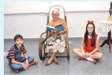
A história da televisão (programas infantis que marcaram a história da TV brasileira) - 4º ano