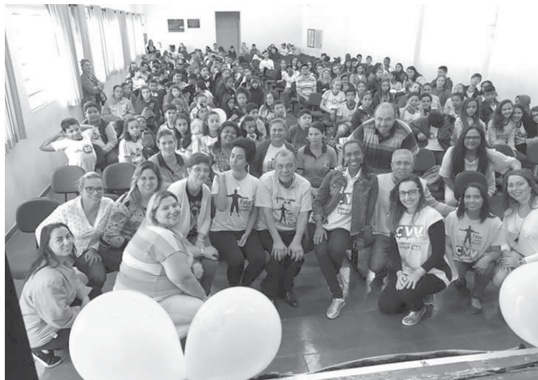
Participantes do Evento