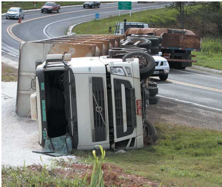
Arquivo "JS 2014"

Na quarta-feira passada (12/9), um acidente que vitimou mãe e filha na MG-050, km 387, chamou a atenção para a necessidade de correção do traçado de curvas sinuosas na rodovia. O assunto foi amplamente debatido após o ocorrido e co-rrado por cidadãos, que lembraram já ter