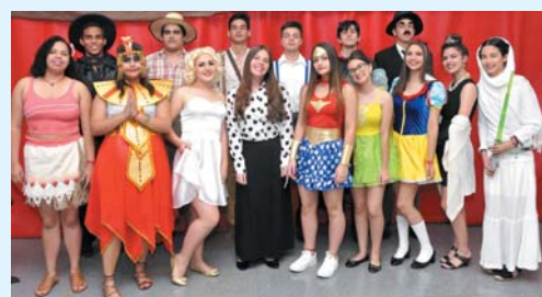
A história do cinema - Do cinema mudo ao cinema atual - 9º ano