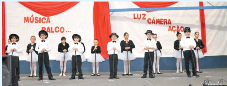
Apresentação de Tributo a Charlie Chaplin - 2º ano