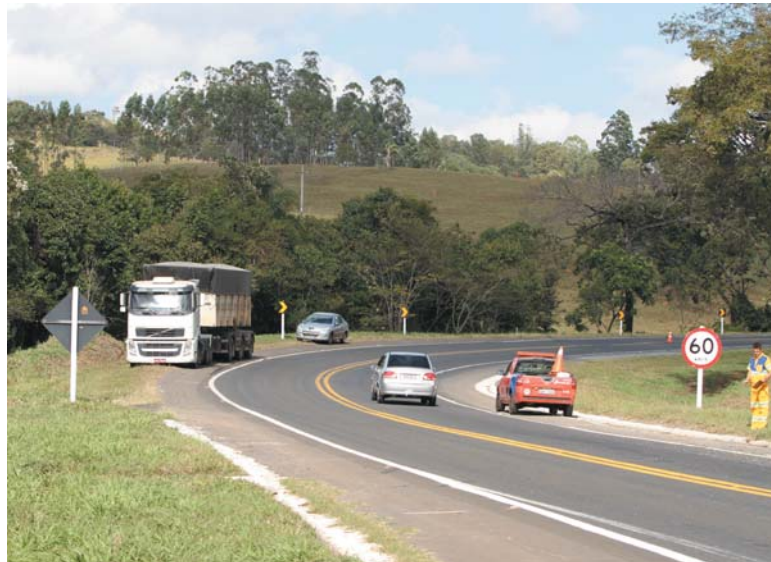
Arquivo "JS 2014"

Ainda, de acordo com a empresa, neste trecho estão em andamento ainda a implantação de 0,9 quilômetros de duplicação, 1 obra de interse-