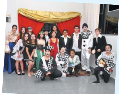
Teatro do Renascimento - Teatro Dell'Arte - Teatro Elisabetano - 7º ano