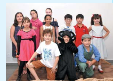
Teatro de Fantoques - A bonequinha preta - 3º ano