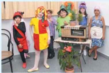
A história da televisão (programas infantis que marcaram a história da TV brasileira) - 4º ano