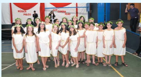
História do Teatro - O Teatro Grego - 6º ano