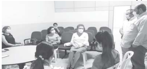
Reunião com equipe da FMRP-USP define participação de voluntários de Itamogi na pesquisa da Janssen em Ribeirão Preto

A Secretaria Municipal de Itamogi iniciou quinta-feira, 30, no Posto de Saúde Cerrado as inscrições das pessoas interessadas em participar dos estudos clínicos referentes à vacina da Janssen. O município firmou parceria com a FMRP-USP (Faculdade de Medicina de Ribeirão Preto), mantida pela Universidade de São Paulo (USP). Podem participar pessoas que não tenham testado positivo para o coronavírus, não tenham recebido nenhuma vacina contra Covid-19, ter entre 18 e 55 anos e estar com boa saúde. A vacinação ocorrerá em Ribeirão Preto (SP) e os participantes terão uma ajuda de custo e o transporte será fornecido pela Prefeitura de Itamogi.