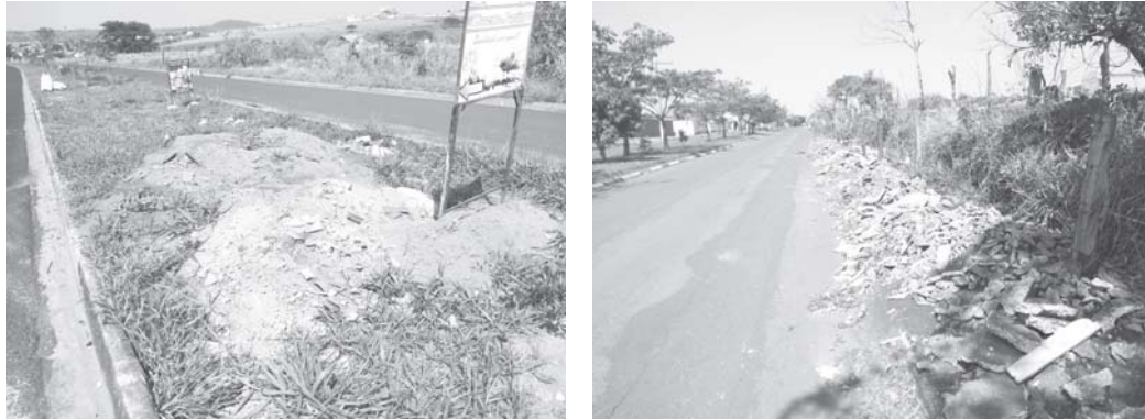
Em vários trechos da Av. Ver. Alfredo Campolongo a calçada e canteiros central viraram depósito clandestino de entulhos