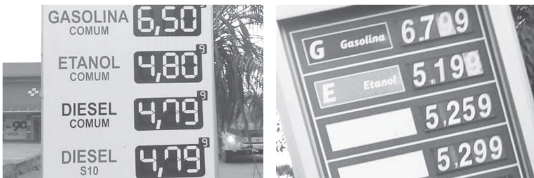
Preços dos combustíveis em Paraíso, sexta-feira (8/10), mais em conta e o mais caro