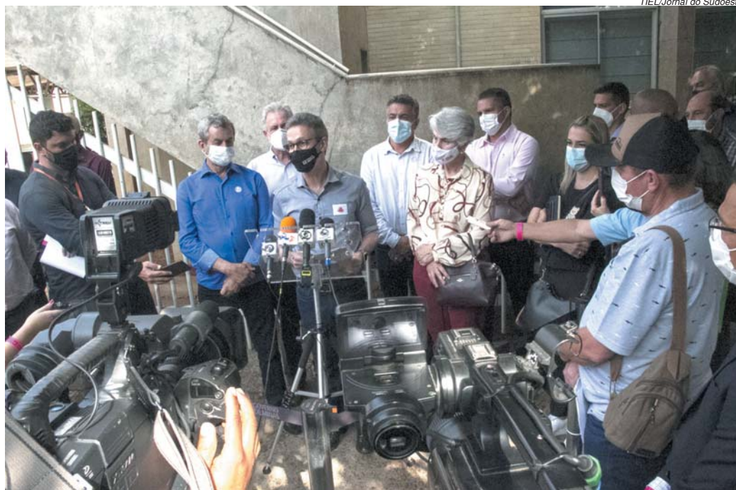
TIEL/Jornal do Sudoeste

Ao comentar sobre desempenho de sua gestão fez comparativos para concluir que o