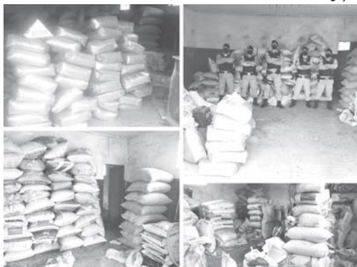
Com ação da polícia vários produtos furtados na zona rural foram recuperados

Durante operação "Batida Policial" a Polícia Militar recebeu denúncia de furto de café em uma propriedade rural, na quinta-feira, 7, em São Tomás de Aquino. Após diligências um suspeito da ação criminosos foi localizado e passou informações sobre um receptor. A polícia encontrou além de nove sacas de café outras 39 sacas de fertilizantes de procedência duvidosa tendo a suspeita de também ser produto de furto. Pelo menos três envolvidos foram encaminhados à Delegacia de Polícia Civil para serem esclarecidos.