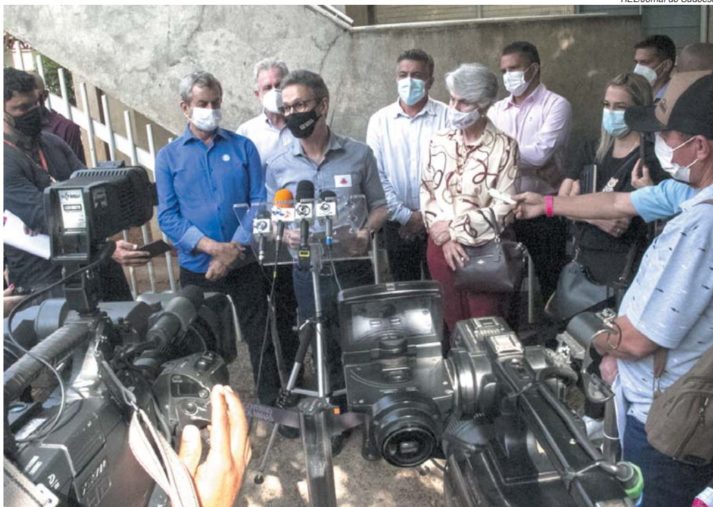
TIEL/Jornal do Sudoeste