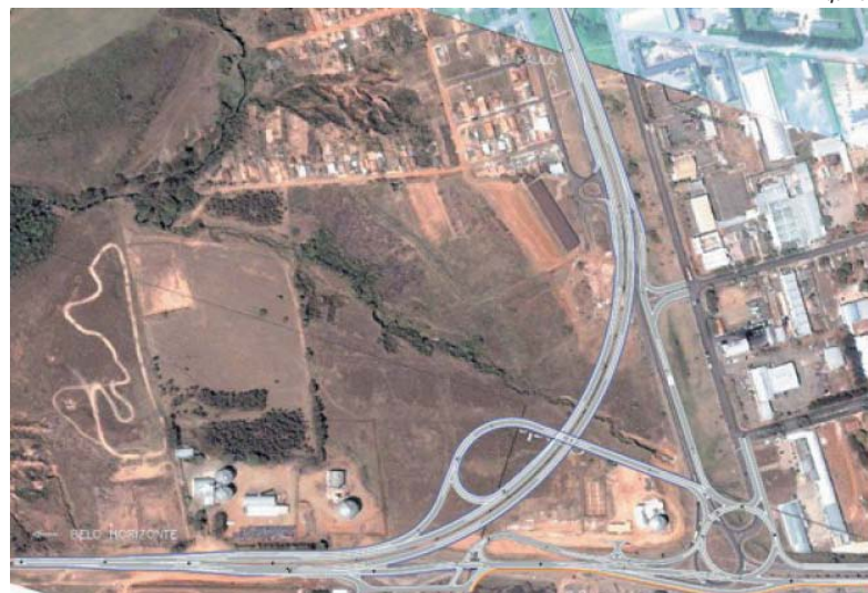
Construção da alça de ligação da MG-050 e a BR-491 depende de questões burocráticas para ter obras em 2020

Estiveram presentes na agenda os deputados estaduais