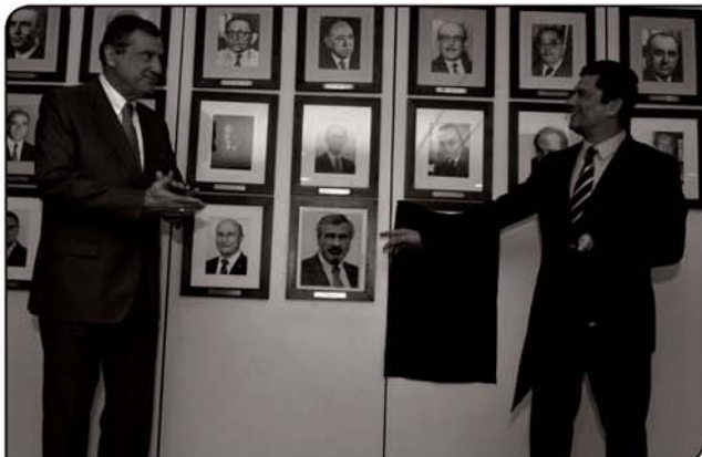
O ministro Sérgio Moro prestou uma homenagem ao ministro Torquato Jardim, fazendo o descerramento de sua foto junto a sala de retratos do Ministério da Justiça