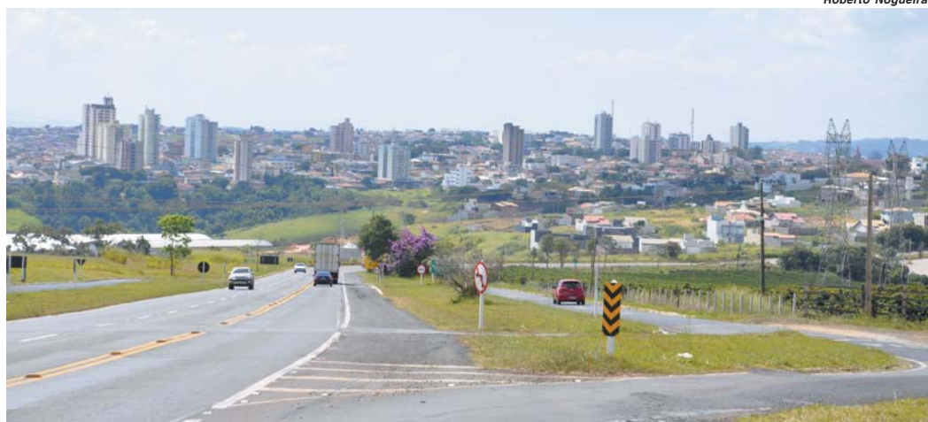
Novo cronograma contempla duplicação de trecho da BR-265 na chegada de Ribeirão Preto

Pelo anunciado as conversações estão bem avançadas e já se pode falar que houve o aceite pelo secretário de obras. "Agora nós temos que