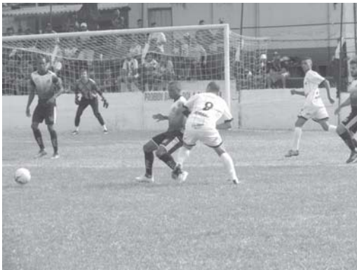
Operário precisa reverter o placar desfavorável para conquista do título inédito

O Operário Esporte Clube lutou com todas as forças, mas não conseguiu segurar a equipe de Santa Rosa de Viterbo, na primeira partida da decisão do 10º Campeonato Regional de Futebol, promovido pela Federação Paulista de Futebol e a Liga Desportiva Serranense. O time do interior paulista abriu vantagem de 2 a 0 e decide o título em casa no próximo domingo, 21. O Operário terá o desafio de vencer por dois gols de diferença para levar a decisão para as penalidades.