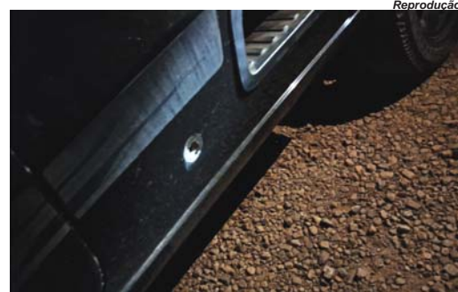
Crime ocorreu no último final de semana, próximo ao aeroporto municipal de Paraíso

De acordo com as mensagens de voz compartilhadas, o familiar relatava que o irmão e três amigos seguiram, na madrugada de sábado, 11, de Paraíso a Itamogi em uma VW Saveiro quando, próximo ao aeroporto municipal, uma caminhonete com luz alta sinalizou para que o condutor parasse o veículo. Na recusa, os suspeitos teriam disparado