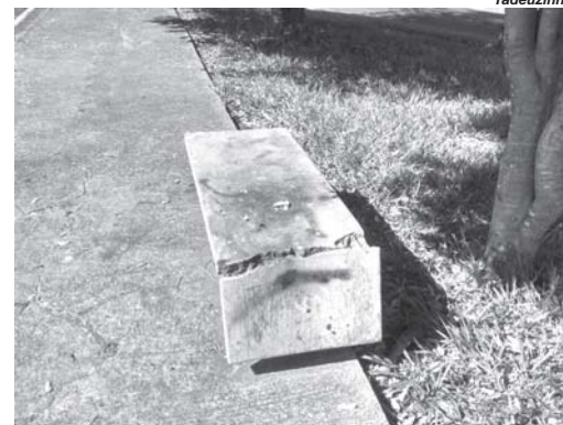
Praça Zumbi dos Palmares, na Vila Sta. Maria, está com o banco de assento quebrado, e vândalo ou preconceituoso arrancaram a placa de ferro que tem o nome da Praça