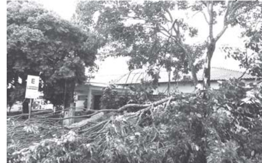
Parte de árvore situada em frente ao posto de saúde do distrito caiu, mas não atingiu moradores

A chuva também causou um incidente inusitado com marimbondos. "Após a tempestade, um galho com uma caixa de marimbondos caiu. O local teve que ser interditado pela Guarda Municipal até a remo-