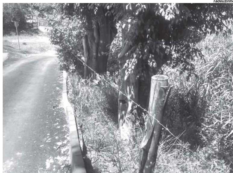
Cerca de arame farpado de um terreno vago na área central de Paraíso, preocupa pedestres

Devido a publicação ter repercutido, leitores procuraram o JS para denunciar também outro grande lote vago dentro do perímetro urbano, onde uma das frentes do terreno está cercado com arame farpado.