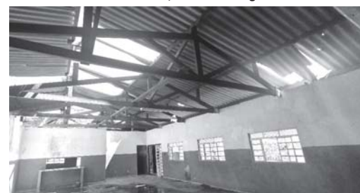
Telhado do galpão da antiga sede da associação dos moradores ficou destruído. Local está em desuso

ção segura dos insetos, que foi feita pelo Corpo de Bombeiros", acrescenta o secretário.