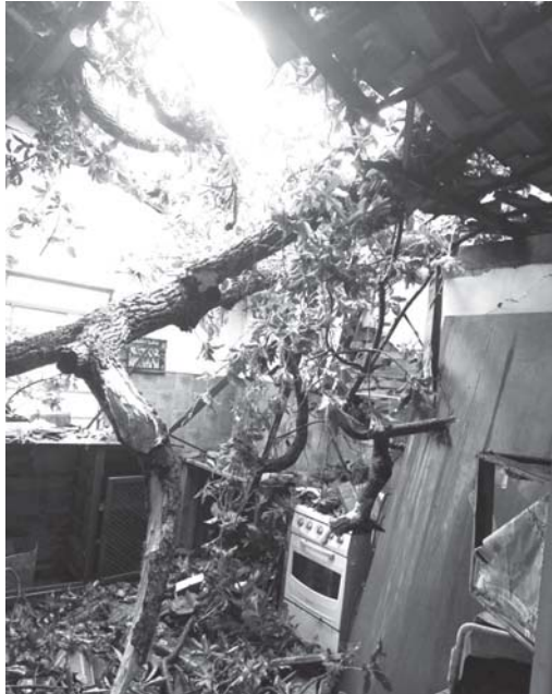
Cozinha e banheiro de uma casa em Guardinha foram atingidos por uma árvore derrubada pela forte chuva