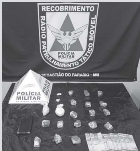
Drogas recebidas em Paraíso seriam comercializadas em cidade vizinha

PM de Paraíso encontrou maconha, cocaína e crack dentro do veículo do suspeito