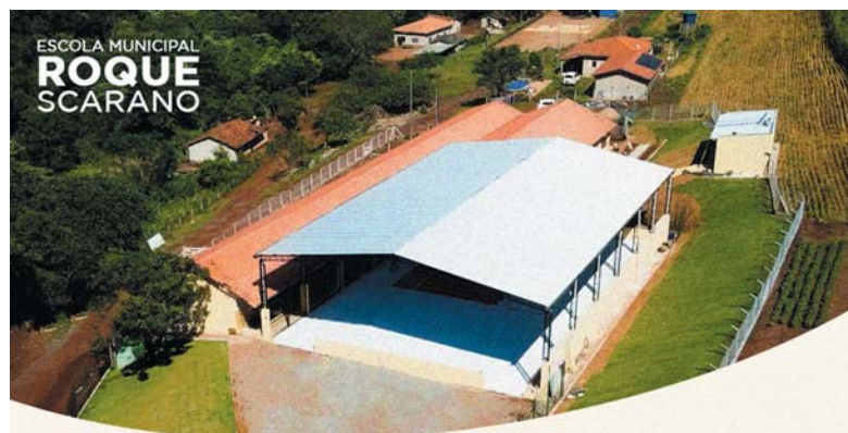
ESCOLA MUNICIPAL ROQUE SCARANO