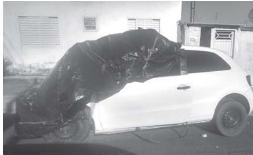
Carcças de veículos abandonados em vias públicas ou terrenos vagos podem ser focos de mosquito transmissor da dengue

públicas dentro do perímetro urbano de São Sebastião do Paraíso, encontra-se carcaças de veículos abandonadas, que além de provocarem um péssimo visual, podem sim, ser também foco criadores do mosquito Aedes Aegypti.