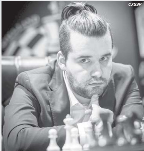
Grande Mestre Ian Nepomniachtchi

O Grande Mestre Russo Ian Nepomniachtchi foi o vencedor do Torneio de Candidatos 2020/21 da FIDE com uma rodada de antecedência e é o novo desafiante para o campeonato mundial de xadrez.