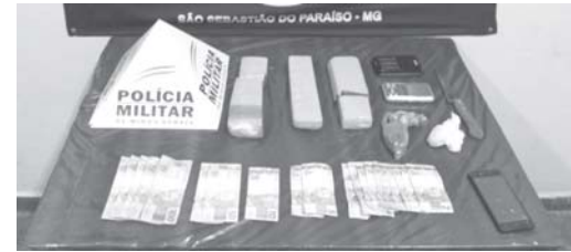
Em duas ocorrências foram localizadas e apreendidas drogas, dinheiro, celulares e materiais utilizados para o tráfico

Pelo menos três pessoas foram presas em duas diferentes ocorrências registradas pela Polícia Militar em São Sebastião do Paraíso. No primeiro caso um casal foi surpreendido após denúncia anônima numa ação que resultou na apreensão de três quilos de drogas distribuídas em três tabletes além de outros objetos e certa quantia em dinheiro. No segundo caso a PM deteve um homem que tinha em seu poder drogas prontas para comercialização, sendo a atividade qualificada como tráfico.