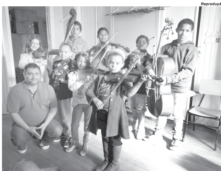
Projeto realizado pelo Serviço de Obras Sociais (SOS Criança) de São Sebastião do Paraíso (Foto tirada antes da pandemia)

Para auxiliar as instituições com interesse em inscrever projetos será realizado um webinar com o objetivo de informar sobre possibilidades e critérios de inscrições. As inscrições poderão se inscrever