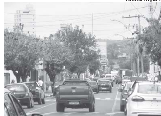
Medida foi justificada como forma de ajudar o contribuinte durante período de pandemia

O Governo de Minas Gerais prorrogou para 1º de julho a exigência do Certificado de Registro e Licenciamento de Veículo (CRLV) de 2020. A decisão foi anunciada é mais uma ação do governo mineiro em auxílio à população durante a pandemia. "Está decidido. Só passará a ser cobrado dos motoristas a apresentação do CRLV 2020 a partir de 1º de julho. É o nosso governo presente com mais uma importante medida para auxiliar as pessoas nesse momento de pandemia", divulgou Zema em sua rede social.