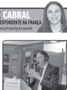
RAICE CABRAL NOSSA CORRESPONDENTE NA FRANÇA @mytastytravel

O mercado mundial de vinhos, afetado pela pandemia da Covid-19, se mostrou resiliente. É o que afirma Pau Roca (foto), diretor da Organização Internacional da Vinha e do Vinho em coletiva virtual a imprensa, direto da sede da OIV, em Paris. Em 2020, o consumo mundial de vinho caiu 3% em volume, uma queda significativa, mas menos dramática do que temia os profissionais da área, devido a crise sanitária que fechou bares, hotéis e restaurantes. Esse foi o registro mais baixo de consumo de vinho no mundo desde 2002.