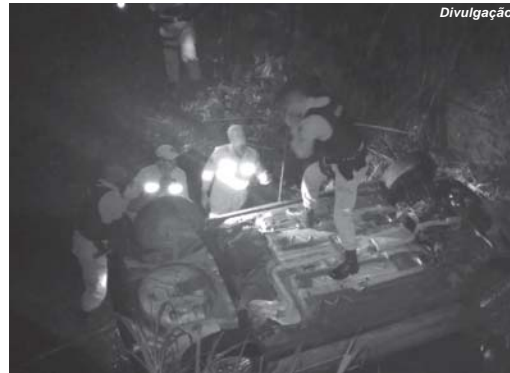
Conforme os primeiros levantamentos, um veículo VW Gol teria saído da pista, passando por uma pequena vegetação de bambu e caído dentro do córrego, embaixo da ponte. A

O Corpo de Bombeiros foi acionado por volta das 21:40 horas, de sábado (24), para atender uma ocorrência na estrada rural que dá acesso à comunidade do Morro Vermelho. Na região, próximo de uma clínica de recuperação (Chácara Pedacinho do Céu), há uma pequena ponte de madeira onde o acidente ocorreu.