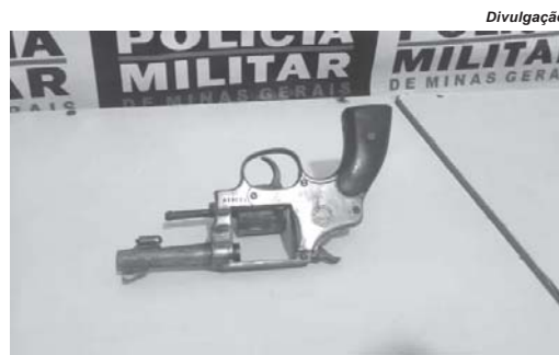
Revólver usado para ameaçar a vítima foi encontrado em um pasto próximo à casa do adolescente

De acordo com ele, o desafeto era com um homem de 28 anos por causa de uma