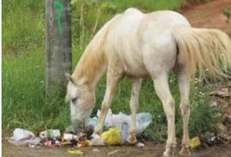
Animal rasga sacos de lixo para se alimentar em região próxima à Câmara Municipal e ao novo Fórum