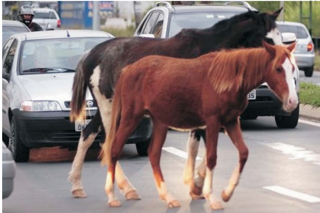
Cavalos atravessam trecho da avenida Zezé Amaral em momento de tráfego intenso, causando transtornos no trânsito

Jovem sofre acidente de trabalho em mercado de Paraíso