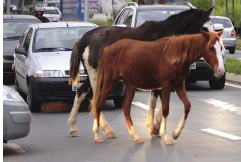
Cavalos atravessam trecho da avenida Zezé Amaral em momento de tráfego intenso, causando transtornos no trânsito