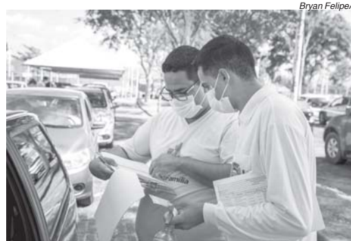
Vacinação ocorrerá em sistema de drive-thru, no estacionamento da Arena Olímpica.

É importante que, no dia da vacinação, aqueles idosos que tomaram a primeira dose, não