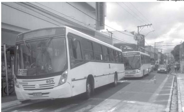
Serviço funciona na cidade de forma emergencial há quase dois meses