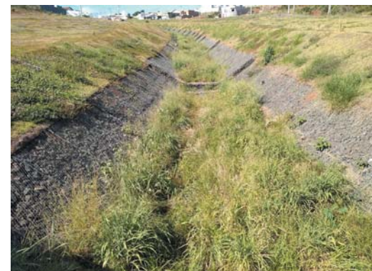
Foto antes de efetuar a limpeza do mato