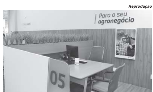
Vaga é destinada para atendimento ao público do agronegócio

A Sicredi das Culturas RS/ MG está com processo seletivo aberto para a contratação de Assistente de Negócios Agro, para atuação no município de Guaxupé. Para inscrever-se no processo seletivo é necessário realizar o cadastro no site https://sicredi.gupy.io/ e candidatar-se à vaga de interesse. As inscrições seguem até a próxima quarta-feira, dia 21. Entre os requisitos e qualificações é necessário ter ensino superior completo em Agronomia, Engenharia Ambiental, Administração de Empresas, Ciências Contábeis, Economia, Gestão Comercial ou áreas afins; desejável experiência profissional em atendimento a clientes do agronegócio; desejável possuir conhecimentos sobre produtos do agronegócio como agricultura familiar, pequenos e grandes produtores, entre outros; ter habilidade em negociação e preferencialmente residir em Guaxupé.