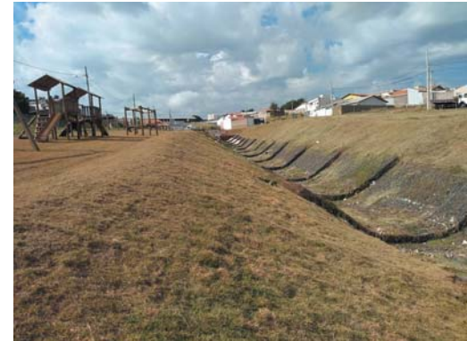
Foto após ter efetuado a limpeza do mato

Pela atenção, rapidez e conclusão total o Sr. Prefeito e a Secretaria de Obras do Município Paraense merecem sim elogios.