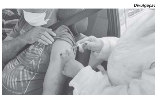
Chegada de novas doses possibilitará que município avance na campanha de vacinação contra o coronavírus

Minas Gerais recebeu nesta sexta-feira, 16, mais de 700 mil doses de vacina contra o coronavírus, enviadas pelo Ministério da Saúde, sendo que 426 mil doses são da AstraZeneca e 275.200 da Coronavac, para dar prosseguimento à maior campanha de imunização do estado. Até o momento, o Minas já recebeu 5.130.139 doses, enquanto a regional de Saúde de Passos, obteve 5.102.862. Des-