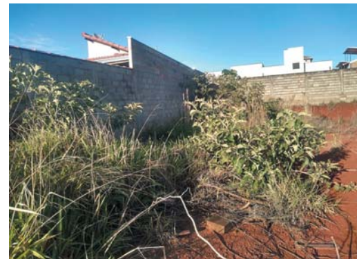
Um dos terrenos vagos, sujo de mato, localizado na Av. Antônio Alves Pinto, no Residencial Alto Paraíso

Para agilizar a limpeza, a Prefeitura pode sim mandar um trator com roçadeira para limpar os lotes sujos e também recolher detritos que possam acumular água de chuva, e mandar a conta das despesas para os proprietários, não só no Residencial Alto Paraíso,