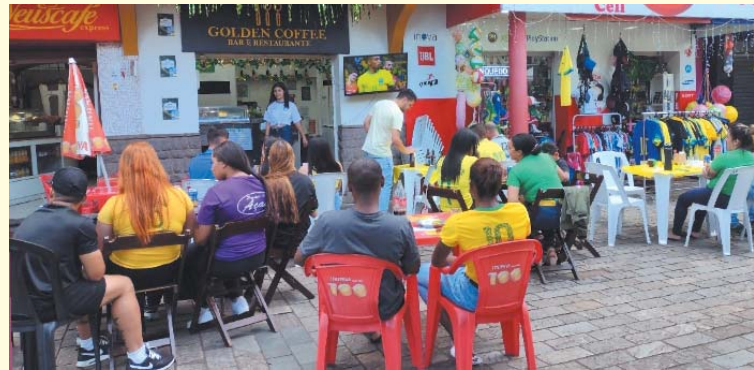
Torcedores se reúnem para assistir jogo do Brasil na Copa

O meio da tarde de quinta-feira, 24, foi marcado por muita correria e expectativa de paraisenses que se preparavam para ver estreia da Seleção Brasileira, no mundial de futebol disputado no Catar, a Copa do Mundo. Aos poucos a cidade foi ficando vazia, com o comércio e demais repartições fechando suas portas para os torcedores assistirem a partida. Terminado o jogo as comemorações foram tímidas mesmo com a vitória por 2 a 0 sobre a Sérvia. No entanto, a expectativa é de que a empolgação será maior na segunda-feira, 28, quando novamente os torcedores vão novamente se reunir para acompanhar o jogo contra a Croácia, a partir das 13 horas.