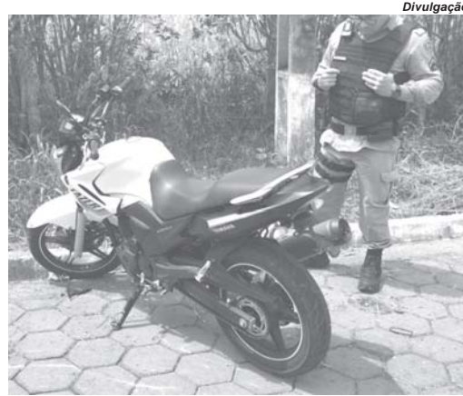
Moto Yamaha Fazer roubada em Paraíso foi levada à Itamogi e foi recuperada pela PM no distrito de Guardinha

Imagens do circuito de segurança do local onde ocorreu o furto flagrou a ação da dupla. Inicialmente um homem forçou