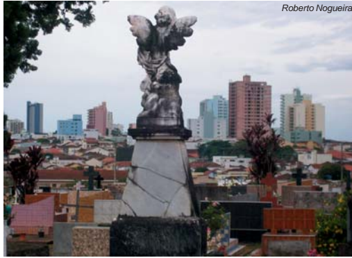
Nova legislação é lançada para regularizar atividade e coibir irregularidades com o comércio de espaços no cemitério

De acordo com o artigo terceiro do decreto, os carneiros ou jazigos serão outorgados a título de permissão, obrigatória a manutenção adequada pelo