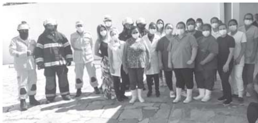
Soldados do Corpo de Bombeiros realizaram ações coordenadas com brigadistas da instituição durante simulado de incêndio no Hospital Gedor Silveira