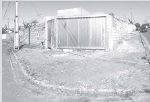
Em fase de construção já bem adiantada, está a sede da Obra Social Luz, Razão e Caridade