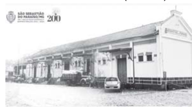
Estação da Mogiana/Casa da Cultura (1927/2021)

feitura programou diversos eventos. No dia 24, domingo, às 7h, será dada a largada do “Bike Tour dos 200 anos”, com saída da Arena Olímpica; às 13h será feita a inauguração do calçamento das 16 ruas do Distrito de Guardinha; às 14h30 a disputa do terceiro lugar Taça Paraíso, com final marcada para às 16h.