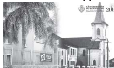
Colégio Paula Frassinetti (1950/2021)