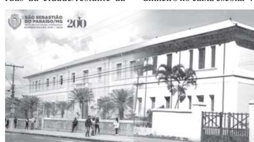
Escola Estadual Paraense (1954/2021)

Igreja São José a Missa de Ação de Graças; às 14h a inauguração do asfalto das ruas do Parque Industrial II e Jardim América. Às 17h será dado início ao Cerimonial 200 anos, no Teatro Municipal, onde será realizado o Ato de assinatura de ordem de serviço para o asfaltamento de 46 ruas da cidade/restante da