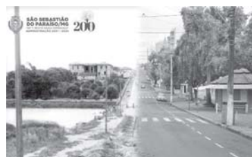
Rua Dr. Placido Brigagão