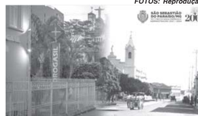
Rua Pimenta de Pádua (1927/2021)