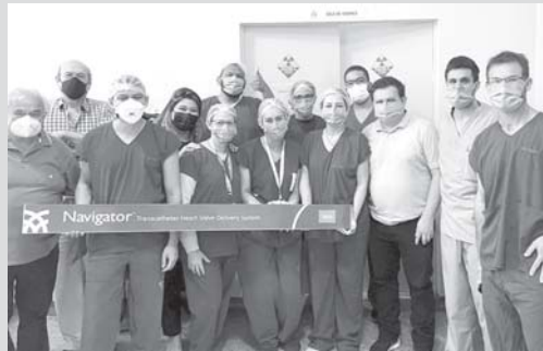
Equipe médica do HRCor comemora mais uma intervenção para implante de válvula aórtica realizada com sucesso em Paraíso

O HRCor (Hospital Regional do Coração), da Santa Casa de Misericórdia, em São Sebastião do Paraíso realizou com sucesso mais um procedimento cirúrgico para implante de válvula. O atendimento foi feito a um paciente de 83 anos teve cerca de 40 minutos de duração. A intervenção é realizada em situações em que o paciente idoso, normalmente, com mais de 75 anos é acometido com estreitamento da abertura da válvula aórtica prejudicando a circulação sanguínea no coração.