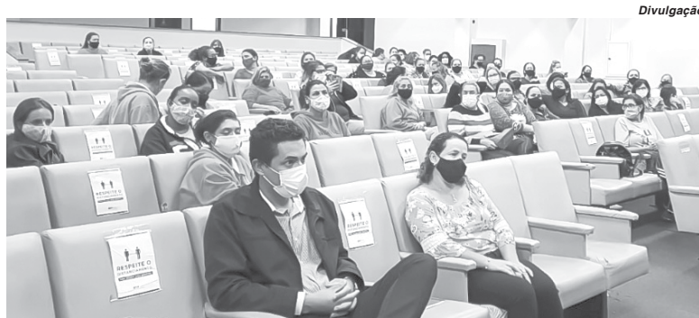
Nos três dias de reunião foram levantadas as demandas para atualização do Plano de Cargos e Carreiras

dos em etapas, sendo que a primeira teve início em 2 de setembro e encerrou na última quinta-feira", observa. Ele comentou ainda que a comissão leu e analisou o Plano em vigor, e também as sugestões propostas pela comissão da administração anterior. "Nesta nova etapa, estamos ouvindo as demandas, através de um