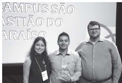
Coordenadores do Projeto Vuei do campus Paraíso receberam o prêmio em cerimônia realizada em Belo Horizonte neste mês