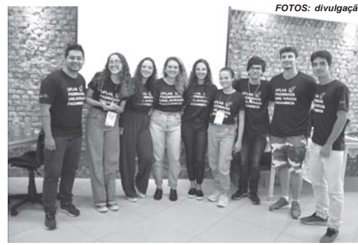
Em 2023, estudantes universitários do campus apresentaram mais de 30 projetos que impactaram a comunidade paraense

Dentre as mais de 30 ações realizadas no campus Paraíso, em 2023, destacam-se a criação do NITESSP, criação do Núcleo de Estudos em Empreendedorismo, Inovação e Tecnologia (Neei Tech), o lançamento da apostila Empreendedorismo e Inovação na Educação, publicações científicas sobre a temática, engajamento pelas redes