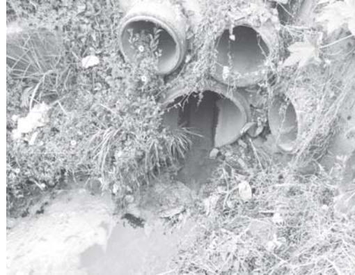
Novamente moradores reclamam e com razão, que esgoto urbano sem nenhum tratamento, continua sendo despejado no Córrego Coolapa

julho empresa Projeto Engenharia que presta serviços para a Copasa, ainda não resolveu este sério problema que está impactando moradores e poluindo o Córrego Coolapa.