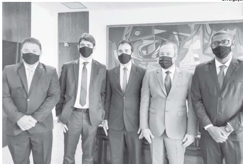
Lideranças aquinenses e da região foram a Brasília e apresentaram reivindicações para os municípios

No encontro com o deputado federal, Emidinho Madeira foram tratados de vários assuntos, questões como cirurgias eletivas, inclusão de São Tomás no programa habitacional Casa Verde e Amarela, além de obtenção de recursos para recapeamento asfáltico foram alguns dos temas debatidos, com o parlamentar. “Estamos de portas abertas e vamos em busca de soluções para as demandas que nos foram apresentadas, com a expectativa de que logo teremos boas novas para anunciar à população de São Tomás”, adiantou o parlamentar.