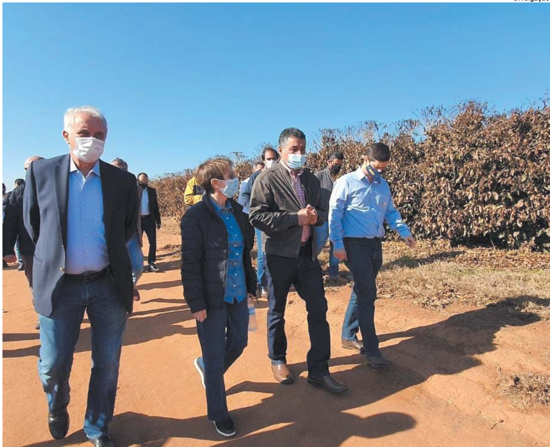
Ministra visitou uma lavoura atingida pela geada bem no início do dia em Alfenas