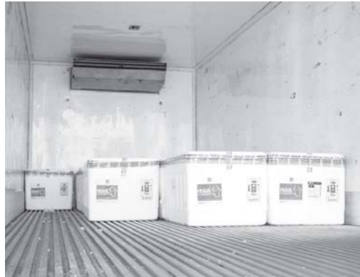
Vacinação está sendo agilizada em Minas Gerais com a chegada de mais doses de imunizantes desde a semana passada

O Governo de Minas Gerais, por meio da Secretaria de Estado de Saúde (SES-MG), começou, nesta quarta-feira 21, a distribuição do 31º lote de vacinas contra a covid-19 para as 28 Unidades Regionais de Saúde (URS). Ao todo, 70% da remessa contendo 841.960 doses será destinada à imunização por faixa etária. Os outros 30% vão para grupos prioritários que serão imunizados com a segunda dose. Para São Sebastião do Paraíso a secretaria informa o envio de vacinas da Pfizer, AstraZeneca e Coronavac.