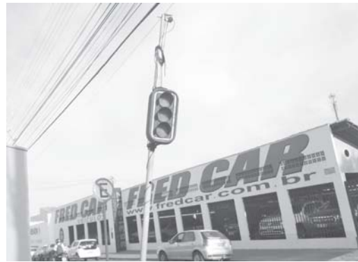
Um dos Semáforos que fica no cruzamento da Av. Monsenhor Mancini, com a Rua Professor Nixon, na Vila Dalva, está sem funcionar há mais de um mês