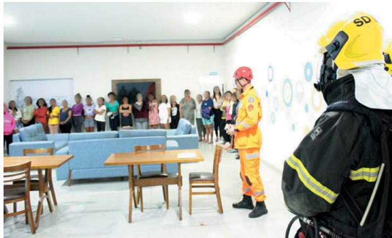
Ao todo, seis militares, 12 profissionais do hospital e 34 pacientes participaram do treinamento

“Operação Rota de Emergência” tem como objetivo prevenir maiores danos em caso de incêndios em hospitais de Minas Gerais