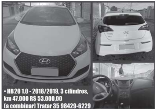
• HB 20 1.0 - 2018/2019, 3 cilindros, km 47.000 R$ 53.000,00 (a combinar) Tratar 35 98429-6229

Vende-se casa na Rua Ana Alarcon Gonçalves, n.º 241 Bairro Morumbi em São Sebastião do Paraíso, contendo sala, cozinha, dois quartos, banheiro, área de serviço coberta. Informações com a proprietária pelo tel. (35) 9 8817 2269 é whatsapp.