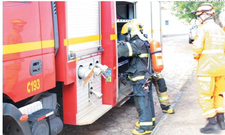
Treinamento teve como objetivo orientar os profissionais e padronizar procedimentos de evacuação em caso de incêndio