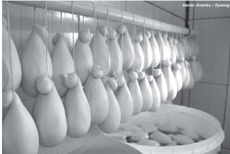
Daniel Arantes / Epamig

No momento, esses trabalhos científicos se encontram