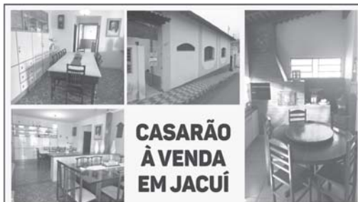
CASARÃO À VENDA EM JACUÍ

• CHÁCARA NAS 3 FONTES: aluga-se, barato, ótimo casarão avarandado do lado do Termas Clube. Tratar 99974-2305