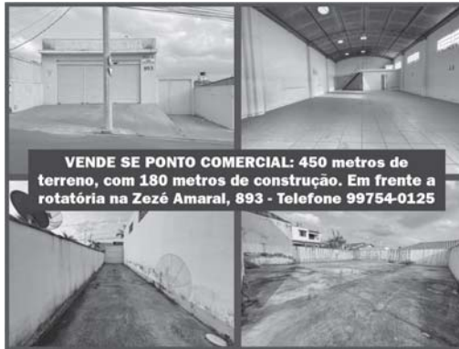
VENDE SE PONTO COMERCIAL: 450 metros de terreno, com 180 metros de construção. Em frente a rotatória na Zozé Amaral, 893 - Telefone 99754-0125