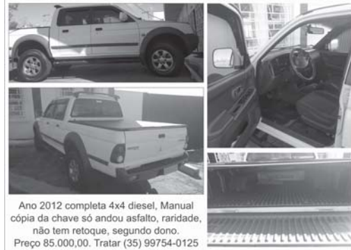
Ano 2012 completa 4x4 diesel, Manual cópia da chave só andou asfalto, raridade, não tem retoque, segundo dono. Preço 85.000,00. Tratar (35) 99754-0125