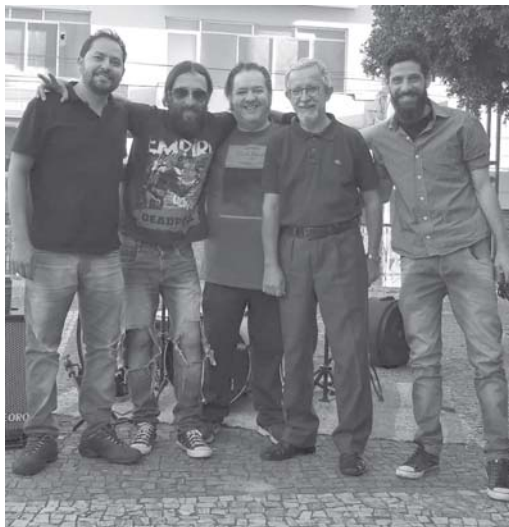
Músicos se reuniram para show de encerramento da Campanha

"Ao lado de grandes amigos músicos, finalizamos as arrecadações com uma pequena apresentação. As pessoas que passavam por ali foram agradecidas com uma tarde gostosa ao som de Raul Seixas, Beatles, Elvis Presley entre outros clássicos do rock, podendo assim fazer mais algumas doações. Contamos com a participação do baterista que integra o con-