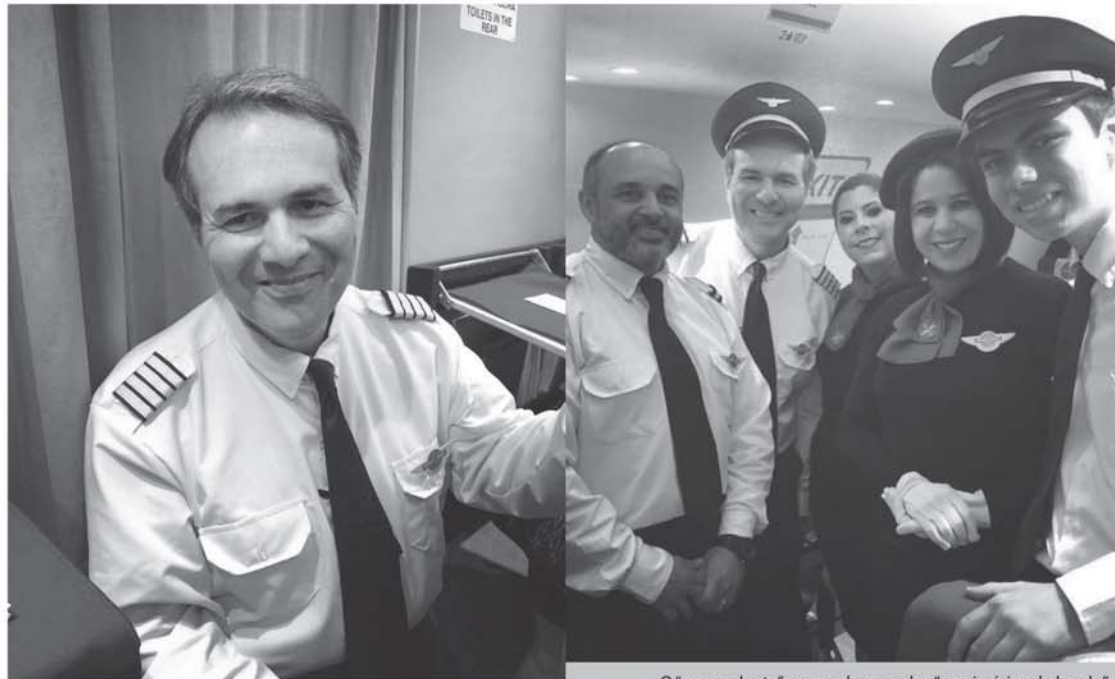
O "comandante" e seus abençoados "comissários de bordo"