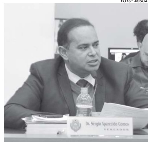
Vereadores demonstram desconforto com situação discutida da Câmara Municipal