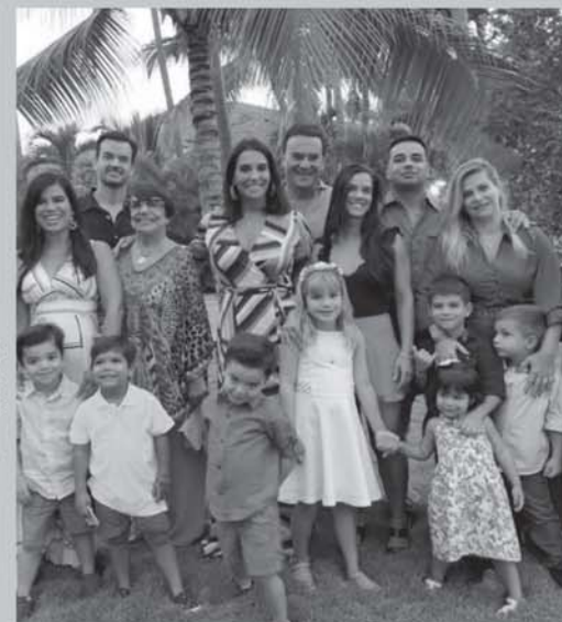
A feliz aniversariante cercada de toda a família