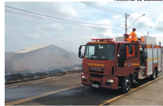
Tiel/Jornal do Sudoeste

Na última semana, por exemplo, um caso mais grave causou grande prejuízo a um dono de lanchonete. O proprietário foi trocar uma válvula de gás e não teria se atentado a uma chama que estava acesa, colocando fogo instantaneamente do imóvel. Apesar dos danos materiais, a vítima teve queimaduras leves de primeiro