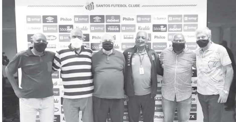
Abel, Mengálvio, Pepe e Lima, o Coringa da Vila, ladeado por Jonas Eduardo Américo Edu e Clodoaldo

O projeto foi lançado em 2014. Com isso Lima que se torna um personagem ligado à presidência do Santos, passa a