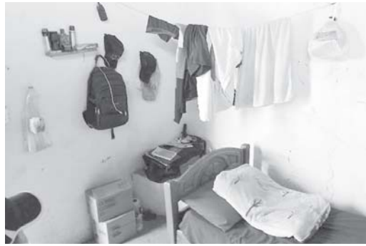
Em Paraíso foram resgatados sete trabalhadores de condição análoga à de escravo na colheita do café