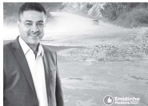
Trecho da BR-265, em Alpinópolis