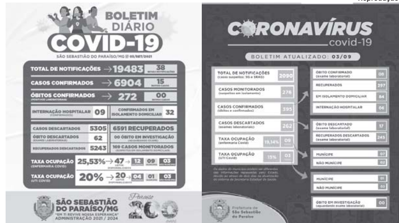
No comparativo entre os boletins de 3 de setembro de 2020 e 2021 verifica-se proximidade na quantidade de Internações por Covid-19

Um dos dados que mais chamam a atenção é que desde o início da pandemia até 3 de setembro de 2020 Paraíso ti-