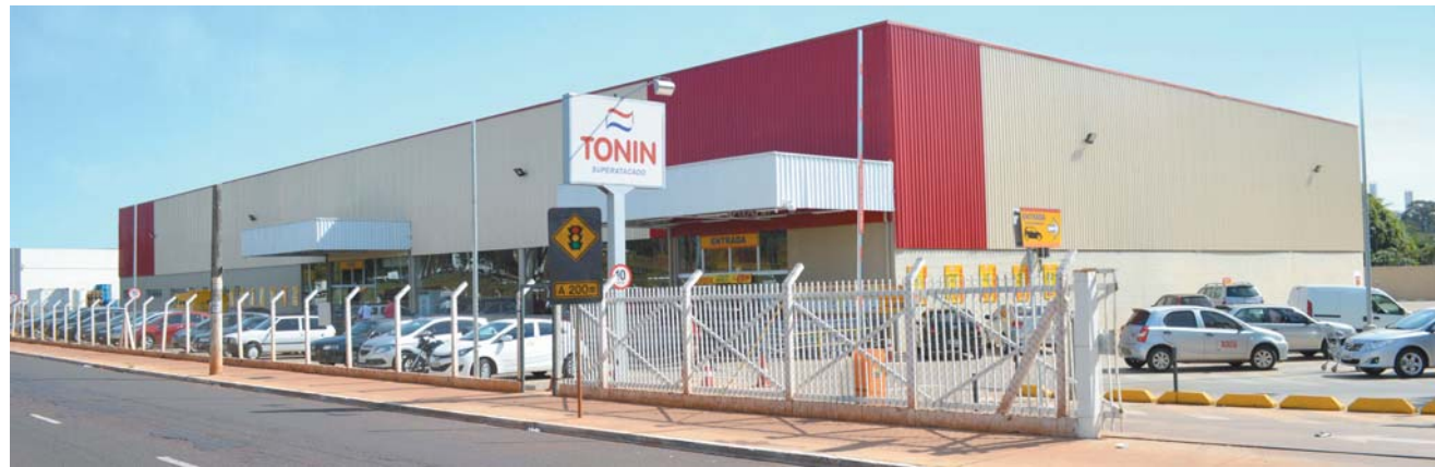
Rede Tonin é um dos maiores grupos do ramo de atacarejo do interior de São Paulo e Sudoeste de Minas Gerais

De acordo com a pesquisa "Panorama sobre mensageria móvel no Brasil", organizada