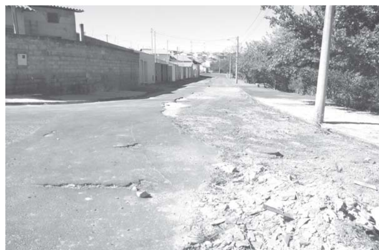
Na Rua Dr. Luiz Pimenta Neves, no Jardim Canadá, está com um de seus quarteirões com a pavimentação danificada e virou ponto de despejo irregular de entulhos, isto há mais de dez anos