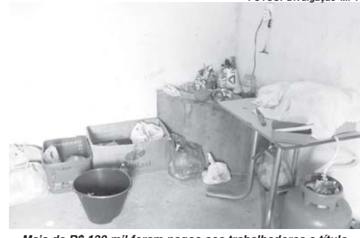
Mais de R$ 130 mil foram pagos aos trabalhadores a título de verbas trabalhistas e indenizações por dano moral

O Ministério Público do Trabalho (MPT) informou ter resgatado sete pessoas em uma fazenda de São Sebastião do Paraíso que estariam atuando em situação análoga à escravidão. Segundo o MPT, os trabalhadores estavam sem receber salário há três meses, cumprindo jornada de até 12 horas. Além de Paraíso, situação semelhante foi registrada em Bom Jesus da Penha (MG). Nos dois casos, mais de R$ 130 mil foram pagos às vítimas a título de verbas trabalhistas e indenizações por dano moral.