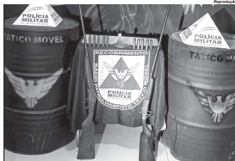
As duas espingardas apreendidas na casa do denunciado não possuíam marca ou número de registro

No cômodo apontado pelo denunciado, a polícia encontrou duas espingardas, ambas sem marca ou número de série, além de um cartucho intacto de arma de fogo de uso permitido e diversos cartuchos vazios e semicargados