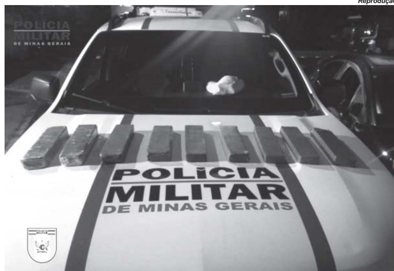
Casal carregava nove tabletes grande de maconha. Mulher ainda tentou dispensar a droga na rodovia

sucedida, o condutor, de 28 anos, tentou fugir a pé, mas acabou detido. Ele resistiu à prisão, e foi imobilizado por um policial. A mulher, de 25 anos, não resistiu à prisão. Na sequência, as autoridades retornaram ao local onde a mochila foi dispensada, encontrando nela nove tabletes grandes de maconha.