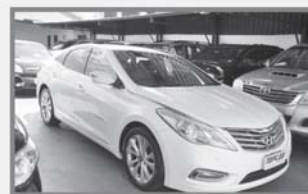
SONATA - 2012 - BRANCO - AUT - COMPLETO + COURO