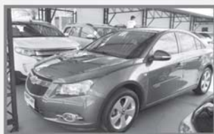
CRUZE LP 2014 - CINZA - AUT - COMPLETO + COURO