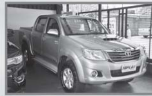
HILUX SRV DIESEL 4X4 - 2015 - PARTA - AUT - COMP. + COURO