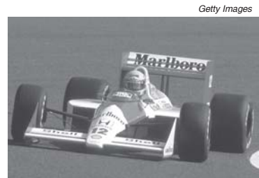
Próxima terça (30) primeiro título de Ayrton Senna completa 30 anos

Apesar de a regularidade de Prost ser melhor que a de Senna, o regulamento daquele ano previa o descarte dos cinco piores resultados de cada piloto. Senna precisou descartar apenas 4 pontos (1 do sexto lugar em Portugal, e 3 da quarta posição na Espanha), já que não havia pontuado no