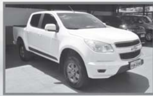
S10 ADVANTAGE - 2016 - BRANCA - COMPLETA - FLEX