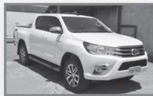
HILUX SRV DIESEL 4X4 - 2016 - BRANCA - COMPLETA + COURO