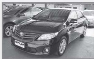
COROLA XEi 2014 - PRETO - AUT - COMPLETO + COURO