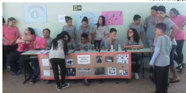
Estudantes de Paraíso fizeram exposição de trabalhos e outras apresentações ligadas ao tema deste ano