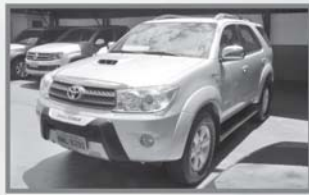
HILUX SRV - 2011 - 7 LUG - CINZA - AUT - COMP. + COURO