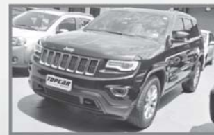
JEEP GRAND CHEROKEE LAREDO - 2014 - AUT - COMP + COURO