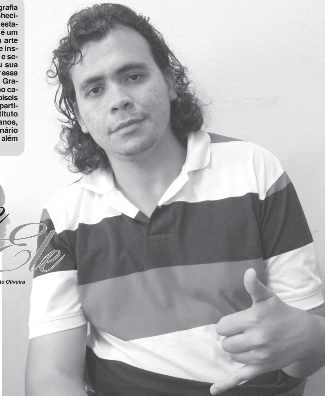
Moiseis é professor em uma escola de música e também ministra aulas particulares via internet

M.B.F.: Todas as pessoas têm condições de aprender o que quer que seja, lógico que pessoas que têm mais facilidade se desenvolvem um pouco mais rápido e outras este processo é mais lento. Mas acredito que tudo depende da dedicação, e penso que a dedicação supera o talento. A pessoa precisa estar focada, ter paciência, tanto quem ensina quanto quem está aprendendo e, também, é importante ir trabalhando por etapas. O que eu acho muito interessante é que você aprende muito ensinando e, o contato com o outro, te faz se adaptar ao