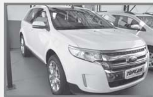
EDGE - 2013 - BRANCA - AUT - COMP + COURO