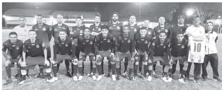
Equipe do Itamarati assume a ponta do grupo B depois de golear o Expressinho por 6 a 1

As redes do torneio de futebol amador balançaram 29 vezes em sete partidas realizadas no último final de semana