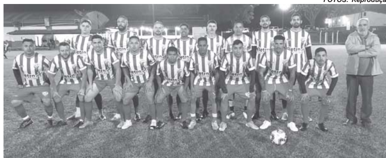
Mocoquinha faz 5 a 0 no Athletic e se recupera na competição