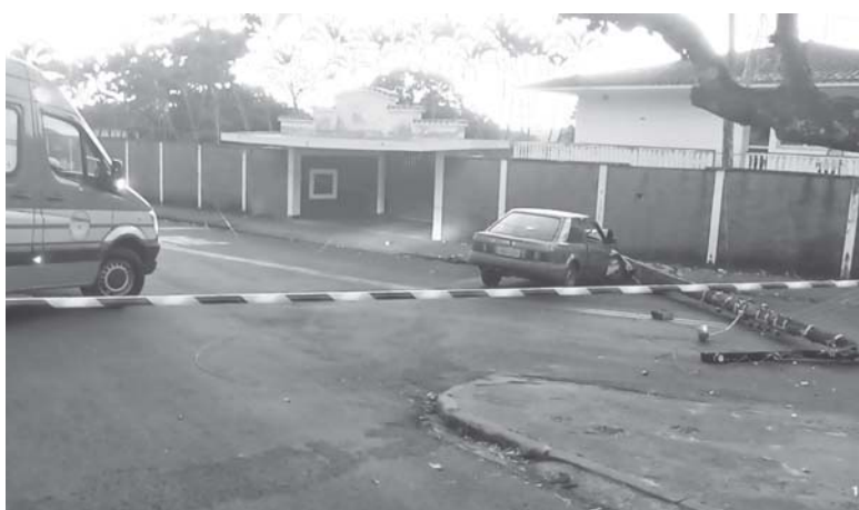
Carro derruba poste e fios de alta tensão caem sobre o veículo no São Judas

No mesmo bairro, na madrugada seguinte, os bombeiros tiveram dificuldades para socorrer um casal que ficou ferido depois que seu veículo se chocou contra um poste. Isso porque os fios de alta tensão caíram em cima do carro e os militares só puderam atender as vítimas depois que a Cemig cortou a energia do local.