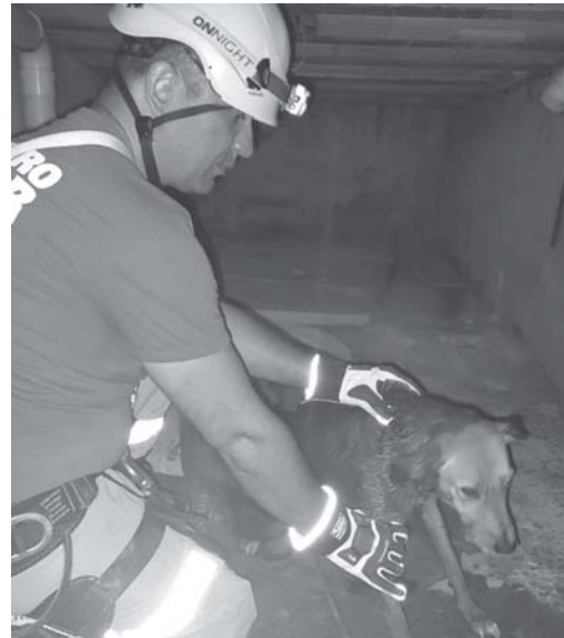
Cão cai em poço e é resgatado por equipe dos bombeiros na cidade de Itamogi

Ao chegar no endereço, a equipe de combate a incêndios se deparou com o forro de PVC de um dos cômodos da casa parcialmente destruído