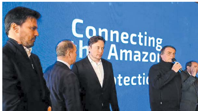
Por Agência Brasil - Brasília

Internet via satélite Starlink oferecerá internet para 19 mil escolas