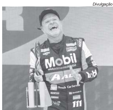
Rubens Barrichello completa 50 anos em plena forma e não pensa em pendurar o capacete

E eu fui um dos que apostaram desde o início que Barrichello seria campeão da F1. Mas o curso mudou. Ayrton Senna a quem até hoje ele chama de "Chefe" e que teria sido uma espécie de mentor, morreu quando Barrichello estava em seu segundo ano na categoria. E Rubinho por sua vez abraçou a responsabilidade de substituir o Chefe, uma