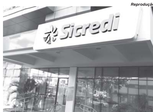
Sicredi das Culturas realiza o crédito de R$ 12,3 milhões na conta dos seus associados

Sendo assim, a poupança no Sicredi rende mais para o associado e o recurso ainda fica na região, desenvolvendo as comunidades locais. Outra parte é para aqueles que escolhem o Sicredi como parceiro para tomar crédito; e, também, para os que utilizam os demais produtos e serviços, como cartões Sicredi, seguros, consórcios, entre outras soluções financeiras.