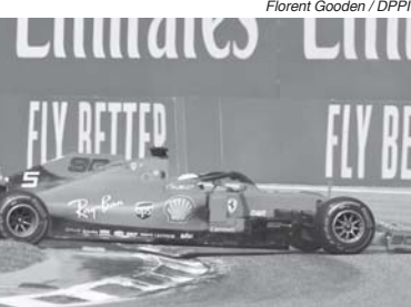
Diante da fanática torcida da Ferrari, Vettel roda na mesma curva em que errou no ano passado

Não se tem nenhum relato de que Sebastian esteja passando por algum problema familiar, e tomara mesmo não esteja. Lewis Hamilton passou por isso quando ainda corria pela McLaren, num período que enfrentou crises de