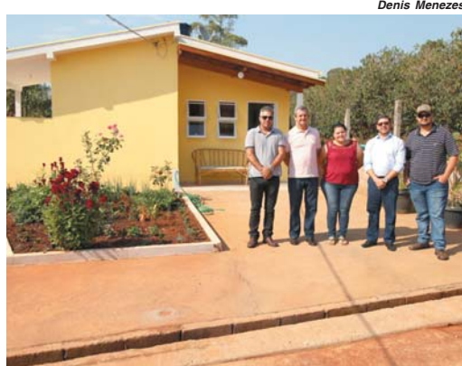
Moradores recebem chaves das casas construídas na zona rural de Paraíso e São Tomás de Aquino

Os contratos foram encaminhados para a Superintendência Regional da CEF (Caixa Econômica Federal) que é um dos agentes financeiros do programa. Para a construção da casa própria rural, o governo federal forneceu ao agri-