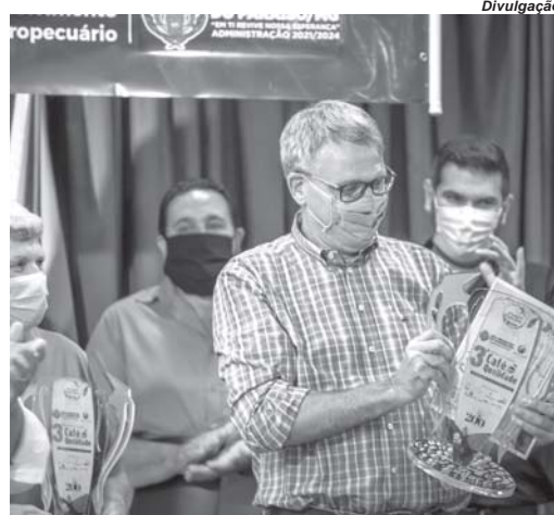
Evento já está na sua 4ª edição

O objetivo do concurso é incentivar a constante melhoria da qualidade dos cafés do Município como meio mais eficaz na conquista de novos mercados, agregando valor ao produto e atendendo à crescente demanda por produtos diferenciados, além de identificar os cafés de qualidade