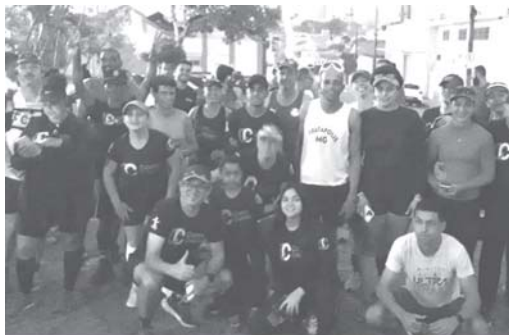
Foram reunidos cerca de 50 atletas na manhã de domingo para a tradicional corrida "Baby Run"