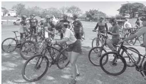
Ciclistas fizeram pedal em prol do Hospital Regional do Câncer de Passos

Integrantes da equipe de atletismo "Corra Comigo" participaram no domingo, 7 de agosto, de mais uma edição da corrida Baby Run. O evento reuniu cerca de 50 participantes que foram até o distrito de Guardinha. Além da prática esportiva, a ação solidária resultou na arrecadação de 50 quilos de alimentos doados pelos corredores.