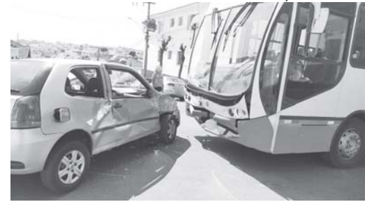
Na região central colisão entre carro e ônibus deixou uma pessoa ferida e danos materiais

Ainda na madrugada de domingo, 7, por volta de meia noite, foi registrado um incêndio em veículo na rua João Marinzeck, Vila Santa Maria. Acionados os bombeiros chegaram ao local e perceberam que o fogo havia sido parcial-