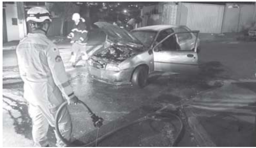
Curto circuito pode ter sido a causa do incêndio no veículo Palio na Vila Santa Maria

O Corpo de Bombeiros atendeu a um acidente de trânsito e um incêndio em veículo no final de semana. Ainda no domingo outro incêndio em uma máquina agrícola precisou do atendimento da corporação. Apenas uma pessoa precisou ser socorrida e foi levada até o hospital com ferimentos leves.