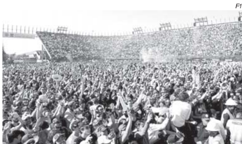
A multidão de mexicanos enlouquecida por Sergio Perez

Mas olhando a tabela de classificação, tem mais disputas das boas em jogo: Lewis Hamilton está apenas 4 pontos atrás de Carlos Sainz, o 5º colocado (202 a 198). Pode parecer pouco, mas é questão de honra para ambos. Sainz vem de uma temporada de altos e baixos, completou apenas duas voltas nas últimas duas corridas, e não cairia bem terminar atrás dos pilo-