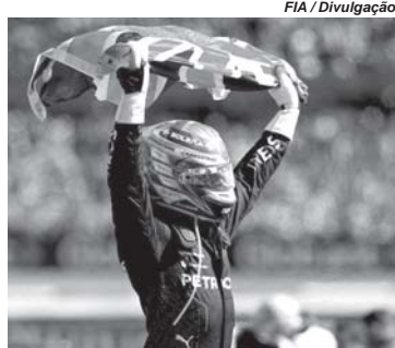
Lewis Hamilton voltou a vencer. E não foi uma vitória qualquer

Hamilton fez história no GP da Inglaterra. O roteiro não poderia ser melhor do que encerrar o longo jejum de vitórias diante de seu público. Nenhum outro piloto venceu tantas vezes em um só lugar como ele em Silverstone, nove vezes! Seu retrospecto no circuito onde a F1 nasceu em 1950 é impressionante: 12 pódios consecutivos, 14 no total desde quando correu em casa pela primeira vez em 2007. Lewis tornou-se o primeiro piloto com mais de 300 Grandes Prêmios a vencer na F1 (ele já disputou 344 corridas), e aos 39 anos e 182 dias passa a ser o piloto mais velho a vencer um GP no século XXI. Vale destacar que nos anos 1950 pilotos como Giuseppe Farina, Juan Manuel Fangio, Piero Taruffi e Maurice Trintignant venceram com mais de 40 anos; Luigi Fagioli tinha 53 quando venceu o GP da França de 1951. Mas eram outros tempos, as exigências físicas e mental a que os pilotos eram submetidos,