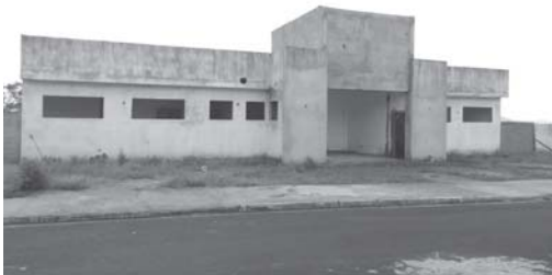
Continua obra inacabada, paralisada e abandonada na Rua Mariuza Alves de O. Silva, no Rosentina 2