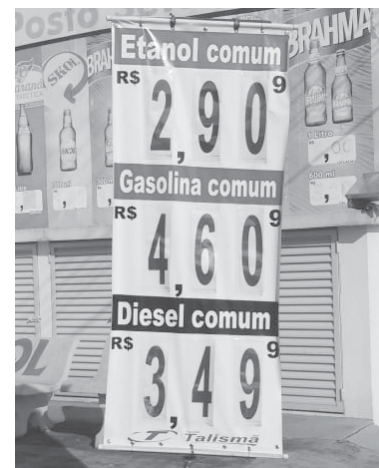
na quinta-feira 28.03.2019

rença de valores cobrados em Minas Gerais e São Paulo (a apenas 25 quilômetros de São