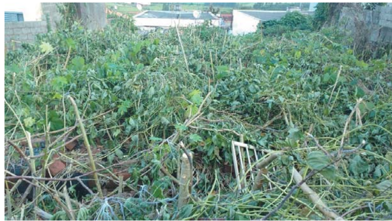
Terreno sujo de matagal cheio de insetos e bichos peçonhentos, preocupa e incomoda moradores da Vila Muschioni 1