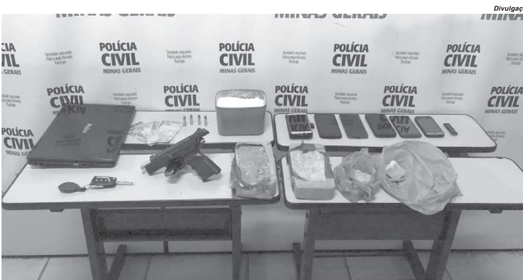
Vários objetos foram apreendidos na residência do suspeito, além de drogas e uma pistola de fabricação israelense

A Polícia Civil em São Sebastião do Paraíso prendeu na tarde de quarta-feira, 27, durante uma operação no bairro Jardim Morumbi, um homem de 27 anos, apelidado por Rico. No interior da residência dele foram encontrados mais de dois quilos de crack, munições e uma pistola de 9 mm de fabricação israelense, além de um veículo Corolla. "Foi um trabalho importante, um duro golpe no tráfico que envolve outras pessoas de Paraíso e também da região", comenta o delegado Tiago Bordini que comandou o trabalho de investigação do caso.