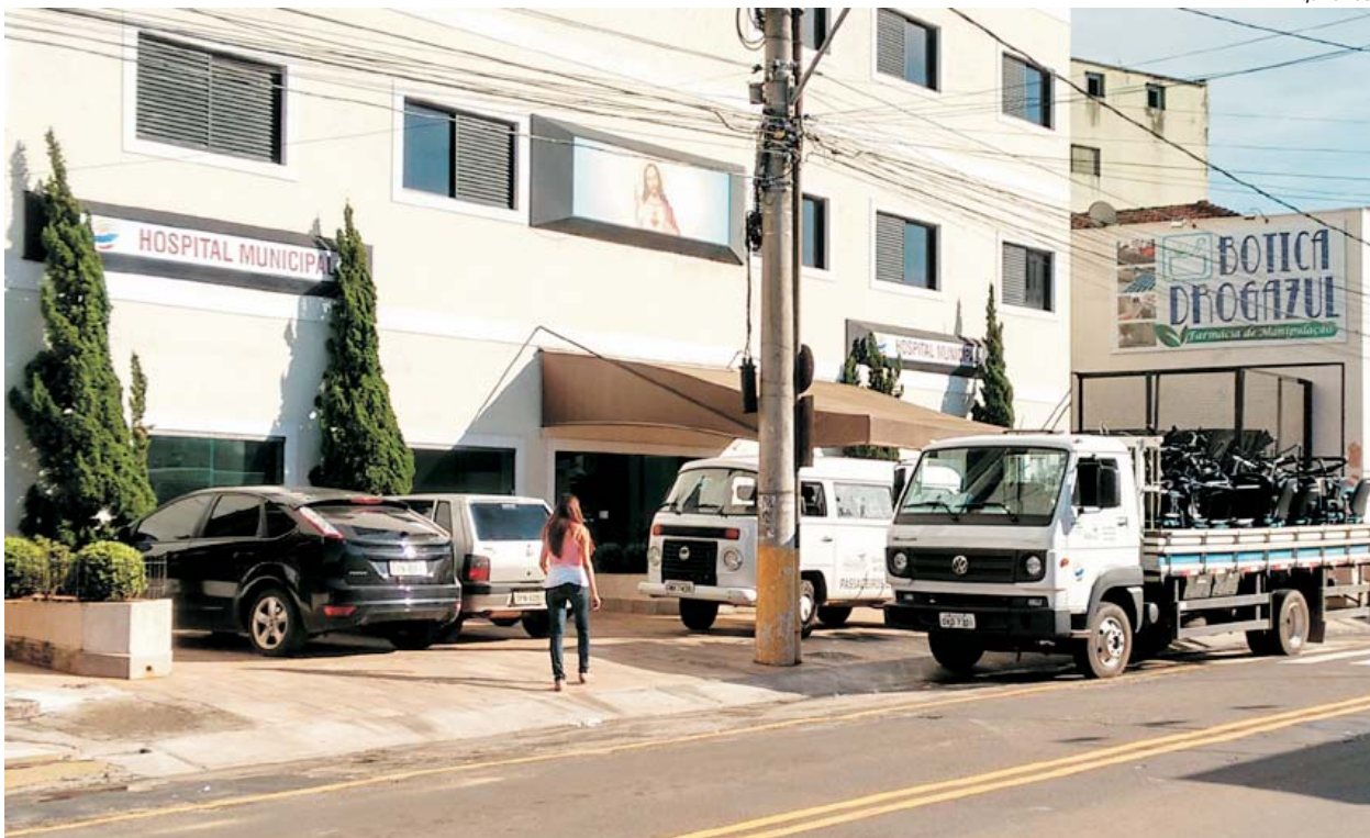
veículos da Prefeitura transportaram mobiliário do município para o Hospital Sagrado Coração, um dia depois da Câmara aprovar o Hospital Municipal

Polícia Civil prende em Paraíso homem acusado de tráfico e porte ilegal de arma