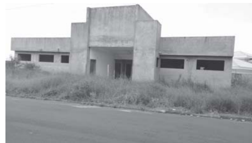
Continua obra inacabada e Abandonada na Rua Luiz Lovo, no Verona