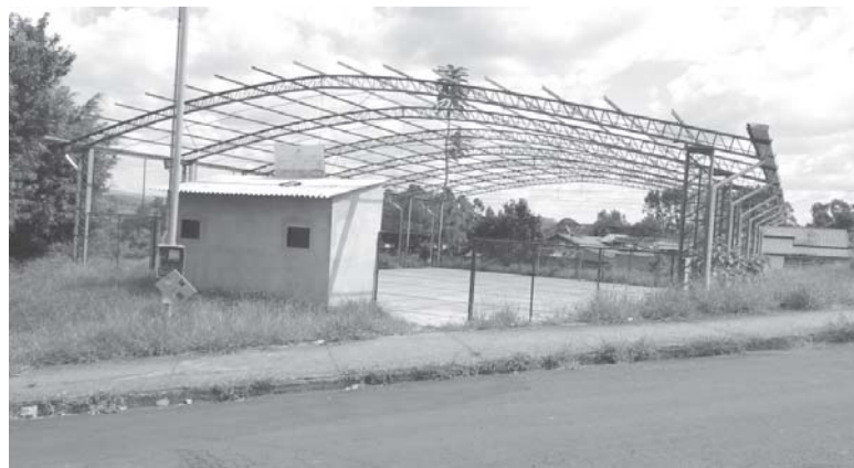
Continua obra inacabada da Quadra Poliesportiva no Bairro São Francisco

Dá pena e causa revolta ver dinheiro público, do contribuinte, do povo, sendo jogado pelo ralo, devido a falta de planejamento, gestão, compromisso e responsabilidade de administradores.