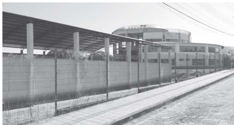
Das quatro obras inacabadas, esta da Escola Professor José Carlos Maldini é a única que reiniciou o andamento da obra

Vereadores deveriam fiscalizar e verificar as causas e apurar responsabilidades de