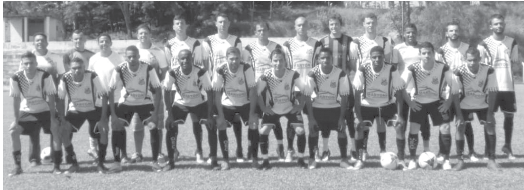
Equipe alvinegra de Paraíso é uma das líderes invictas do campeonato com duas vitórias

O Operário E.C. é um dos líderes do Campeonato Regional de Futebol Amador promovido pela Liga Desportiva Serranense em conjunto com a Federação Paulista de Futebol. O time de São Sebastião do Paraíso está no Grupo A ao lado dos times do Cravinhos A, Brodowski, São José da Bela Vista, São Simão e Serrana. A equipe local vem de duas vitórias consecutivas e neste domingo, 31, tenta se manter na liderança enfrentando o Cravinhos.