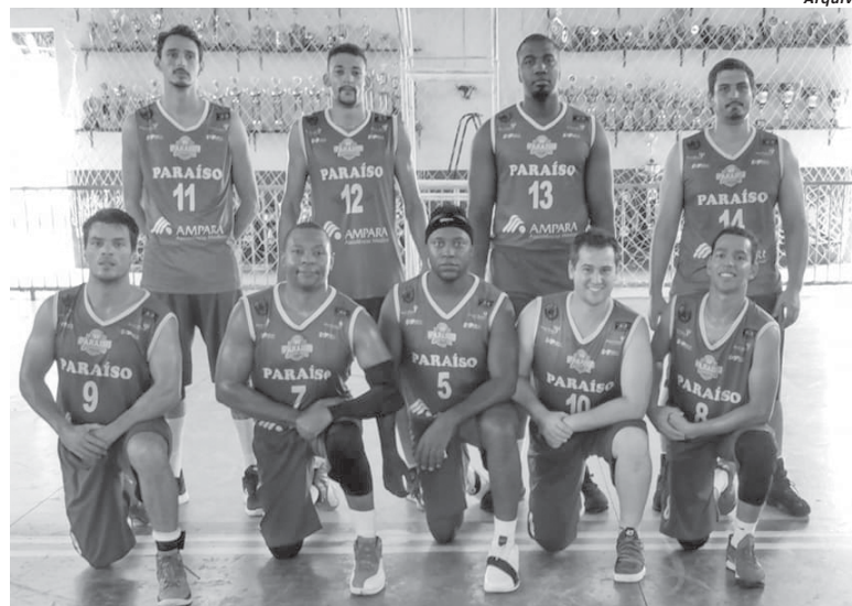
Instituto Paraíso tentará manter boa fase neste ano ao enfrentar São Carlos pela Copa Difusão

Depois de uma semana de treinos e expectativa para a próxima partida da Lidarp o Insti-