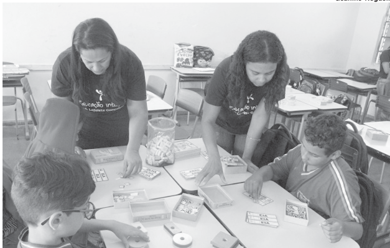
Três escolas mantidas pelo Estado em São Sebastião do Paraíso iniciaram atividades em tempo integral

Cerca de 500 escolas estaduais iniciaram nesta segunda-feira, 6, a primeira etapa das atividades da Educação em Tempo Integral de 2019. As ações envolvem em toda Minas Gerais cerca de 30 mil estudantes do Ensino Fundamental e a expectativa é de que a partir do segundo semestre mais 25 mil vagas sejam retomadas. Em São Sebastião do Paraíso, conforme informação obtida junto a 35ª Superintendência Regional de Ensino são três estabelecimentos escolares que irão fornecer as atividades.