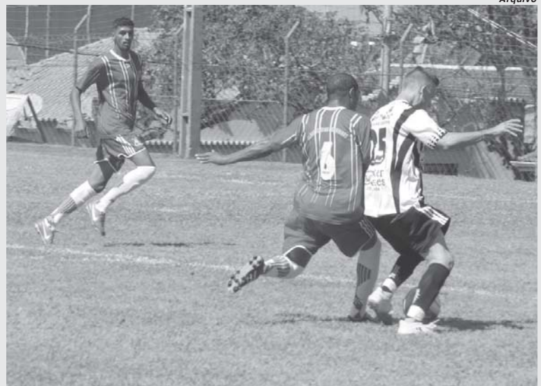
Operário tenta segunda vitória em casa no campeonato amador da FPF e Liga Serranense