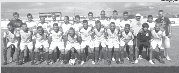
Paraisense lidera o Campeonato de Veteranos e faz o clássico contra o Operário no domingo