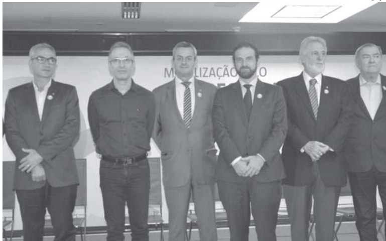
Lideranças representantes dos governos federal e estadual participaram do lançamento do programa

Com o objetivo de mapear os entraves que prejudicam o desenvolvimento da economia, aumentar a competitividade entre empresas, reduzir a burocracia e, como consequência, gerar empregos, foi lançado pelo governo federal, em Belo Horizonte, o programa Mobilização pelo Emprego e Produtividade, do Ministério da Economia. Minas Gerais foi escolhida para dar início ao projeto, que passará por todos os estados brasileiros, identificando e debatendo políticas públicas para gerar emprego e renda aos municípios. O deputado 1º vice-presidente da Assembleia Legislativa de Minas Gerais, Antonio Carlos Arantes e o presidente nacional do Sebrae, Carlos Melles participaram da solenidade junto com o governador Romeu Zema.