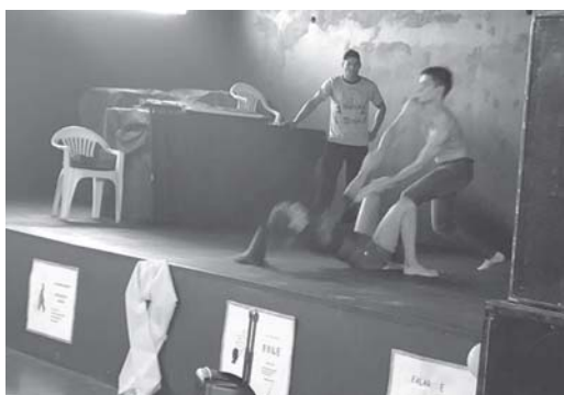
Circo Social de São Tomás