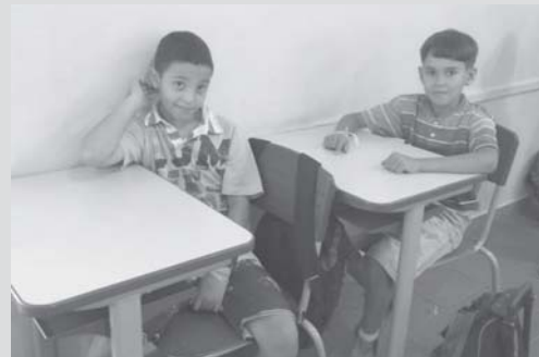
Alunos com as novas carteiras escolar

inaugurada e na quinta (20/9) fez a entrega de novas carteiras o que vai proporcionar mais confort