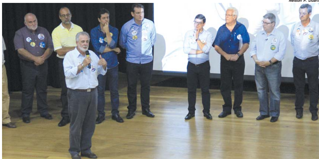
Nelson P. Duarte

O candidato ao governo do Estado, Antonio Anastasia, esteve em São Sebastião do Paraíso na tarde de segunda-feira (24/9), onde se encontrou com lideranças da região. Re-ceptionado no Teatro Acissp, ele disse que a situação de Minas é preocupante e estará empenhado na reorganização das contas públicas.