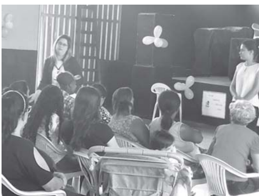
Palestrantes falando aos convidados do evento