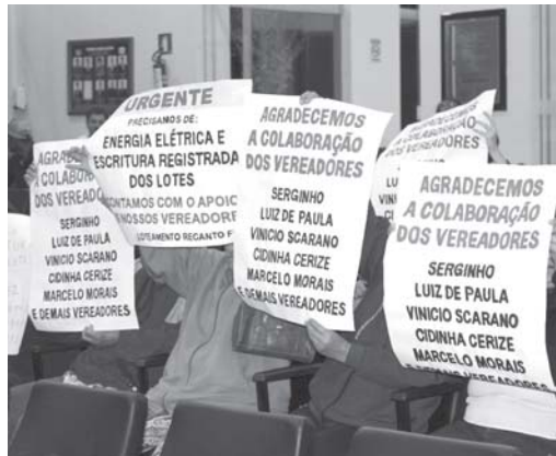
Em junho de 2018, dezenas de proprietários de imóveis no Recanto Feliz foram à Câmara reivindicar providências. Caso ainda não foi resolvido

Ao município foram encaminhados diversos documentos, mas em desacordo com a legislação, sendo necessários