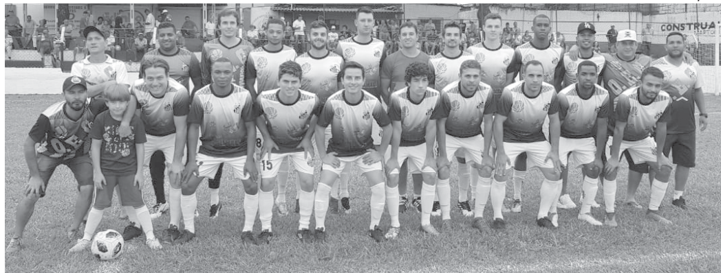
Operário busca mais uma vitória em casa para ter vantagem de decidir em casa no restante do campeonato

A DIRETORIA DA APAC (ASSOCIAÇÃO DE PROTEÇÃO E ASSISTÊNCIA AOS CONDENADOS), INSCRITO NO CNPJ SOB O Nº 04.097.675/0001-51, NA RUA SALVADOR GRAU, Nº68, CENTRO (CASA DO ADVOGADO), SÃO SEBASTIÃO DO PARAÍSO/MG, CEP: 37.950-000, ATRAVÉS DE SEU ÚLTIMO PRESIDENTE VIGENTE, CONVOCA A TODOS OS PARAISENSES À COMPARECEREM NA ASSEMBLEIA GERAL ORDINÁRIA PARA ELEIÇÃO DE NOVA DIRETORIA EXECUTIVA, CONSELHO DELIBERATIVO E CONSELHO FISCAL, BEM COMO A POSSE DOS MEMBROS ELEITOS NESTA ASSEMBLEIA, A QUAL SERÁ REALIZADA NO DIA 25 (VINTE E CINCO) DO MÊS DE JUNHO DESTE ANO DE 2019, SENDO AS 16H A PRIMEIRA CONVOCAÇÃO, E 16:30H A SEGUNDA CONVOCAÇÃO, QUE SE REALIZARÁ COM QUALQUER NUMERO DE PRESENTES.