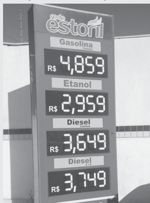
No Posto Estoril que fica localizado na Av. Engenheiro Washington Martoni no jardim Ouro Verde, onde vende o preço do litro da gasolina e do etanol mais barato em Paraíso