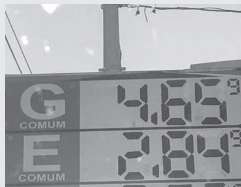
Na Rede de Posto San Marino na Cidade de Uberaba MG, o litro da gasolina custa R$ 4,659 do Etanol R$2,849. Redução foi conforme estabelecida pela Petrobras

Nesta sexta (7/6) o preço mais em conta da gasolina em Paraíso estava por R$ 4,859 e também o etanol a R$ 2,959 no Posto Estoril na avenida Engenheiro Washington Martoni no Jardim Ouro Verde. O litro de diesel mais barato na mesma data, no Posto do Trevo, início da MG 050, saída para Itaú de Minas, por R$ 3,52.