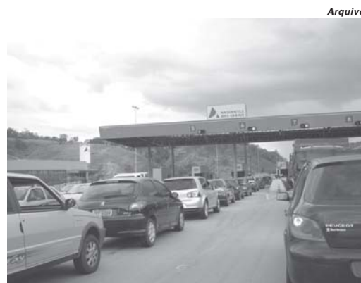
A partir de quinta-feira, 13 de junho, será cobrado o novo valor da tarifa nas seis praças de pedágio da MG-050

O anúncio do reajuste feito antes do início do mês desa-