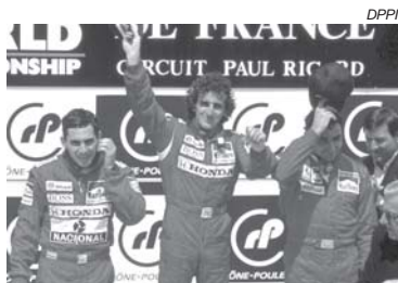
Alain Prost, entre Senna e Alboreto, venceu 4 vezes o GP da França em Paul Ricard

Paul Ricard é uma pista convidativa para os pilotos irem além do limite do traçado por