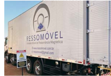
RESSOMÓVEL E CAMINHÃO DA MAMOGRAFIA