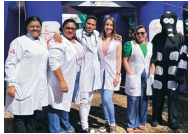
TENDA DA VIGILÂNCIA EM SAÚDE

Na programação comemorativa aos 138 anos consta para este sábado às 8 horas, inauguração da sala de Raios X no Hospital. As 10 horas desfile cívico, das 13 às 17 horas, "Praça da Alegria", na Praça Cônego Tomás. Entre às 17 e 18 horas, cerimônia para corte do bolo de aniversário da cidade, e às 18 horas Cinema Kids (cinema ao ar livre para crianças).