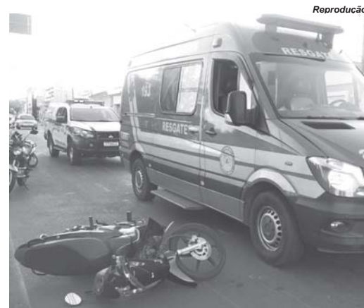
Segundo informações, motociclista tentou fazer ultrapassagem pela direita quando foi atingida pela porta do Fiat Uno

De acordo com as informações, o condutor de um Fiat Uno estava prestes a estacionar próximo ao semáforo para permitir que um passageiro descesse. No momento em que a porta do veículo foi aberta, a motociclista, que tentava fazer uma ultrapassa-