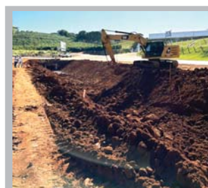
OBRA DO CÓRREGO