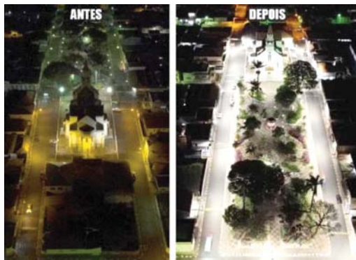
ILUMINAÇÃO DE LED

No esporte São Tomás de Aquino voltou a ser referência regional depois de ter passado por fase difícil. No JEMG, equipes foram campeãs ano passado e neste ano. Voltamos com o handebol o futebol de salão retornou aos seus melhores dias, e há treinamentos para categorias de base. O que não falta em São Tomás hoje em dia são atividades, sociais, esportivas, culturais, e mesmo assim ainda falta alguma coisa, por isso vive