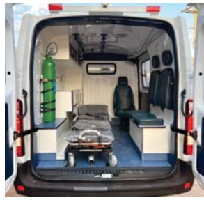
AMBULÂNCIA PADRÃO UTI