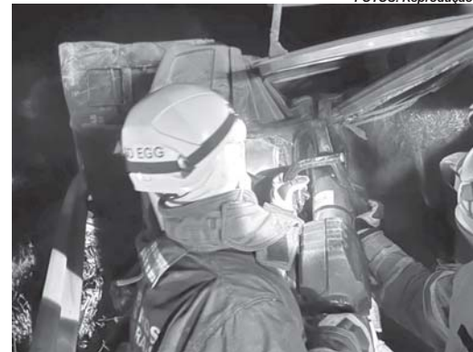
Bombeiros tiveram trabalho para retirar o corpo da vítima em meio às ferragens

Ele não resistiu aos ferimentos e morreu no local. O fato ocorreu por volta das 3h20. A carreta tem placa de Pains, município mineiro que tem como base de sua economia a extração de calcário.