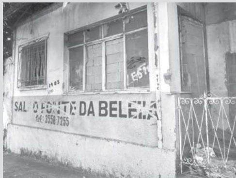
Dois casas antigas e de má conservação e com depósito de lixo, preocupam transeuntes e moradores do centro de Paraíso