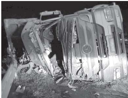
Carreta, que estava carregada de calcário, teve a cabine destruída após o capotamento

Homem de 51 anos não resistiu aos graves ferimentos e faleceu no local. Bombeiros tiveram trabalho para retirar o corpo em meio às ferragens