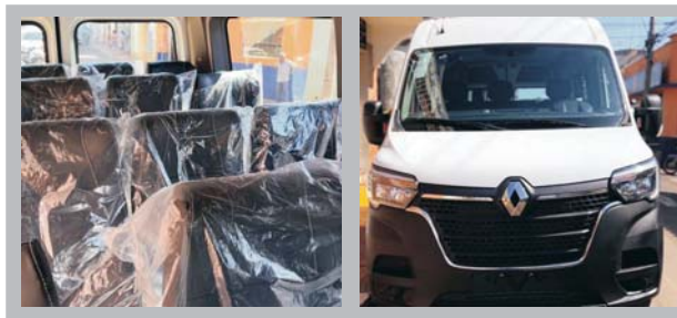
VAN COM ACESSIBILIDADE