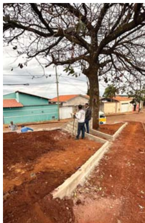
CONSTRUÇÃO NOVA PRAÇA DO ROSÁRIO