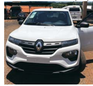
VEÍCULO 0 KM