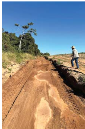
MANUTENÇÃO DE ESTRADAS