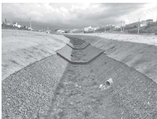
Nesta necessária e bela obra de saneamento básico, vai precisar de constantes cuidados de serviços de manutenção

Outra obra que precisa ser iniciada o mais breve possível em torno do aterro e do plantio do gramado, é a calçada, por-