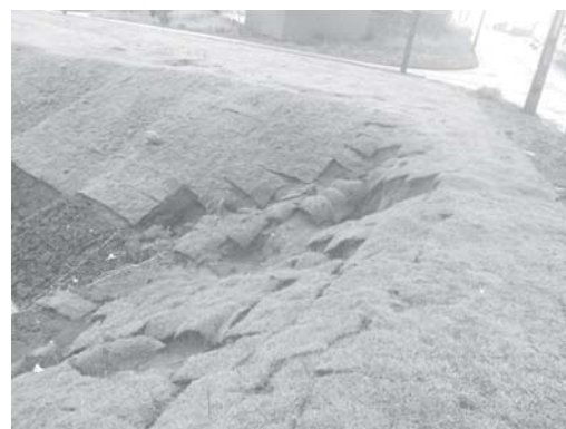
No início da obra de canalização de águas pluviais do Jardim Mediterranèe, placas de gramas se soltaram

que com a intensidade das chuvas volumosas, poderá ocorrer erosão onde é a calçada, e se estender pelo aterro afora.