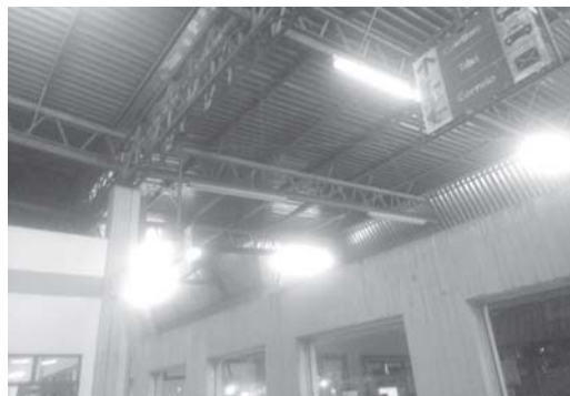
Sebastião Tadeu Ribeiro

O Terminal Rodoviário Angelo Scavazza continua com a constante presença de pombos que provocam grande sujeira, que além de enfeitar o local, chegada e saída de passageiros, o que causa má impressão, ain-