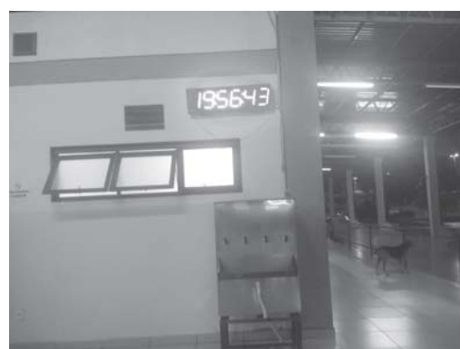
O ônibus que deveria sair em viagem às 19h20 horas somente partiu às 19:56:4

"Um dia depois (21/1), no mesmo horário levei meu filho, que também para utilizar o ônibus, no mesmo horário das 19h20, mas que somente saiu