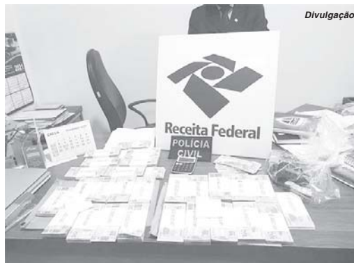
Segundo a Receita Federal, é a maior operação de combate a fraudes tributárias do setor de café já realizada

Ao todo, 58 pessoas foram denunciadas por organização criminosa e falsidade ideológica após a conclusão de parte das investigações da Operação Expresso. Dentre elas 14 são de Minas Gerais; 36 são do Paraná; 3, de São Paulo; 4 são do Espírito Santo; e uma, do Mato Grosso. Dos 14 mineiros envolvidos na investigação pelo menos duas pessoas são naturais, possuem residência e