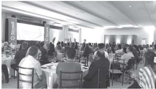
Assembleia do Sicredi em São Sebastião do Paraíso

Voto eletrônico é a novidade das Assembleias da cooperativa