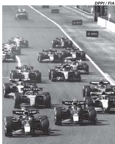
Red Bull segue dominando na F1, mas no cronômetro as equipes estão mais próximas

Em ritmo de corrida a história muda. Red Bull, Ferrari, McLaren, Mercedes e Aston Martin dominam a zona de pontuação e o que sobra são migalhas que o japonês Yuki Tsunoda está aproveitando ao máximo na medida em que alguém tropeça. Tsunoda, da Racing Bulls, ou RB se preferir (nome da ex-Alpha Tauri), é o 11º colocado com 7