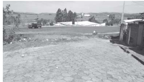
Sinalização inadequada provoca transtornos a Motoristas de Carretas em Rua sem Saída na Vila São Pedro