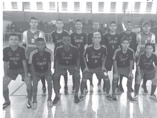
Time de garotos de Paraíso teve boa apresentação em Mococa no fim de semana