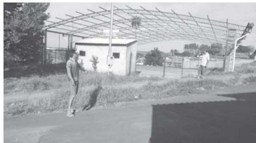
Indignado, morador do Parque São Francisco mostra enorme buraco bem de frente da Quadra Inacabada