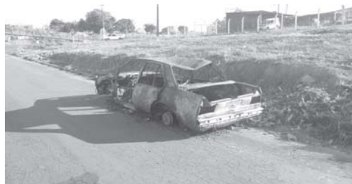
Carro velho incendiado e abandonado em uma das Ruas do Parque São Francisco