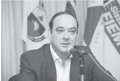
STF julgará a ação no dia 29/04 e a ministra Carmen Lúcia será a relatora

O julgamento dos Embargos de Declaração apresentados pela União, com a intenção de limitar o benefício de exclusão do Imposto sobre Circulação de Mercadorias e Serviços (ICMS) do cálculo do Programa de Integração Social e do Programa de Formação do Patrimônio do Servidor Público (PIS) e da Contribuição para o Financiamento da Seguridade Social (COFINS) será realizado no dia 29/04, pelo Supremo Tribunal Federal (STF). A relatora será a ministra Carmen Lúcia. A Federação das Indústrias de Minas Gerais (FIEMG), reitera sua preocupação quanto ao resultado deste julgamento, pois a exclusão do ICMS da base de cálculo do PIS/COFINS representa um grande benefício econômico para o setor produtivo. As empresas, no momento do cálculo do PIS/COFINS, podem abater o valor relativo ao ICMS em seus produtos ou mercadorias relativas às suas atividades econômicas.