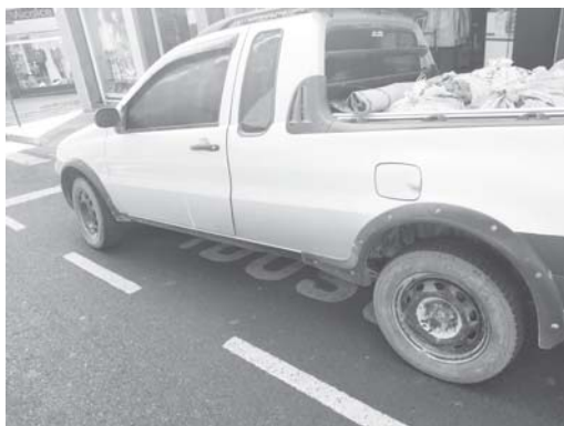
Na Rua Pimenta de Pádua, no centro de Paraíso, veículo estacionado irregularmente na vaga para idosos