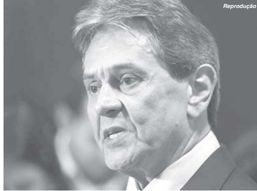
Por Cristina Indio do Brasil Repórter da Agência Brasil Rio de Janeiro

Prisão foi determinada pelo ministro do STF Alexandre de Moraes