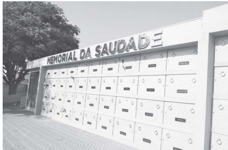
No novo Cemitério Ecológico, Memorial da Saudade, desde o primeiro sepultamento em 01 de Maio de 2020, até nesta quinta-feira 12 de agosto, houve 102 sepultamentos

Neste ano de 2021 que ainda está pela metade do mês de agosto os números sepultamentos informados são até 31 do mês de Julho. Então, de janeiro até 31 de julho foram sepultados aqui em Paraíso 479 pessoas, uma média recorde em sete meses de 68,43 de sepultamentos.