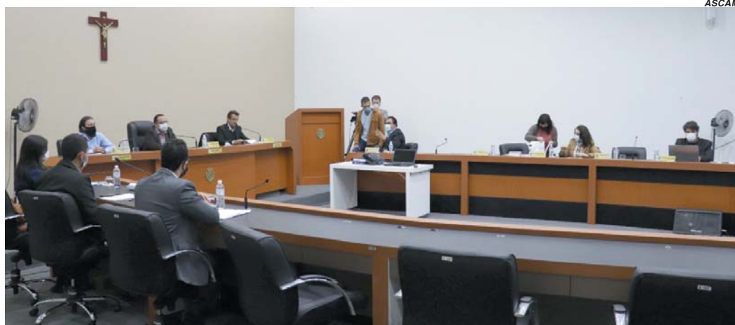
Audiência teve exposição de vários pontos de vistas sobre a municipalização na educação e contou com a participação do prefeito pela internet