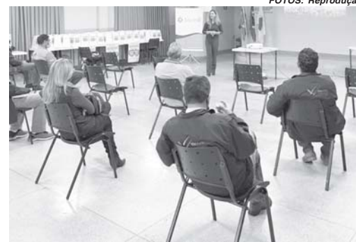
Reunião entre Sicredi e entidades agrícolas em São Sebastião do Paraíso

SOBRE O PALESTRANTE: Roberto Rodrigues é engenheiro agrônomo e agricultor, coordenador do Centro de Agronegócio na Escola de Economia de São Paulo, da Fundação Getúlio Vargas (FGV EESP) e embaixador especial da Organização das Nações Unidas para Agricultura e Alimentação (FAO) para as Cooperativas. Foi professor do Departamento de Economia Rural da UNESP – Jaboticabal, primeiro Titular da Cátedra de Agronegócios da ESALQ USP, presidente do LIIDE Agronegócios, do Conselho Superior do Agronegócio da FIESP -