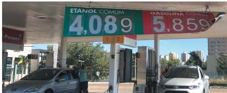
Nesta Quinta Feira, 01 de Julho, consumidor Paraense abasteceu o seu carro em Uberaba, pagou R$ 5,859 no litro da gasolina e R$ 4,089 no etanol

Para finalizar, ele pede explicação sobre o fato, isto se houver explicação, do preço do litro da gasolina em Paraíso custar em média R$ 6,25 e o etanol R$ 4,70. E conclui que há postos de revenda de combustíveis em Paraíso que vendem o litro da gasolina por R$ 6,299 e etanol por R$ 4,799.