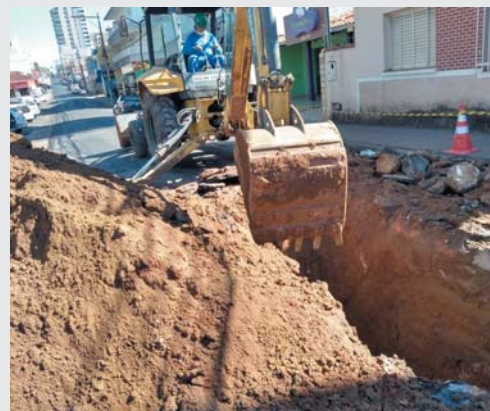
Copasa está trabalhando para descobrir de onde está vindo despejo de esgoto clandestino, que está sendo jogado sem nenhum tratamento na Canalização do Córrego Coolapa