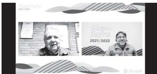
Sicredi das Culturas realizou live de lançamento do Plano Safra com participação do ex-ministro da Agricultura, Roberto Rodrigues

O panorama do agronegócio no Brasil foi o tema da live de abertura do Plano Safra 2021/2022 da Sicredi das Culturas RS/MG. O tema foi abordado pelo ex-ministro da Agricultura, Roberto Rodrigues, que apresentou em sua fala a importância do agronegócio brasileiro para o mundo.