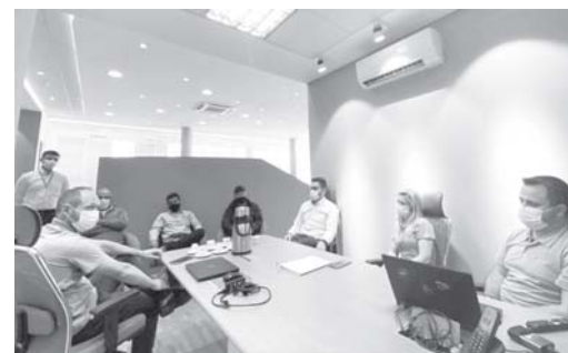
Reunião entre Sicredi e representantes de entidades agrícolas Muzambinho

COSAG, da Organização das Cooperativas Brasileiras (OCB), da Sociedade Rural Brasileira (SRB), da Associação Brasileira do Agronegócio (ABAG), da Academia Nacional de Agricultura da SNA e da Aliança Cooperativa Internacional (ACI). Além disso foi secretário de Agricultura do Estado de São Paulo (1993/1994) e Ministro da Agricultura, Pecuária e Abastecimento (2003/2006).