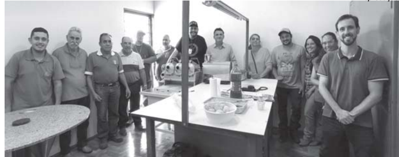
Representantes de diversos setores e produtores rurais se encontraram na sede da Emater na última semana