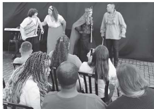
Além do teatro, o festival contou com apresentações musicais, exposições de arte e performances de kung fu

"Nosso grupo teatral tem trabalhado muito nessa missão