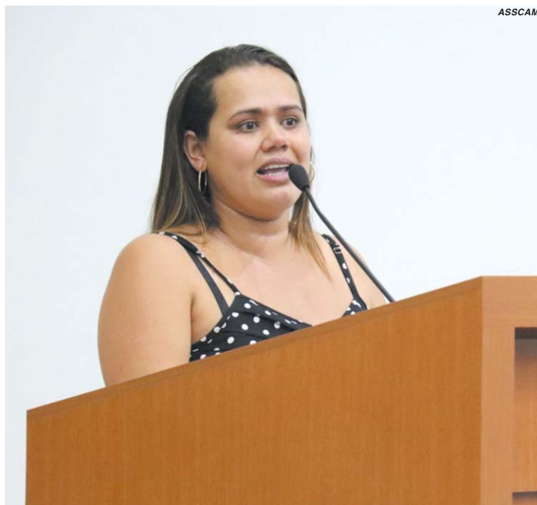
Mãe chorou na tribuna ao relatar que não sabe o que fará no próximo ano com as creches em período parcial

"Se ele já assinou a população que se dane? Ele está a favor desse período parcial e lavou as mãos? Nós (mães) que demos nosso jeito? É isso o que a gente entende. Nós não fomos comunicadas, simplesmente avisaram que a partir do ano que vem não vai ter período integral. Meu filho ficava em uma creche ótima e a diretora avisou que alunos do primeiro período vão ser transferidos para outra creche em período parcial, caso consiga