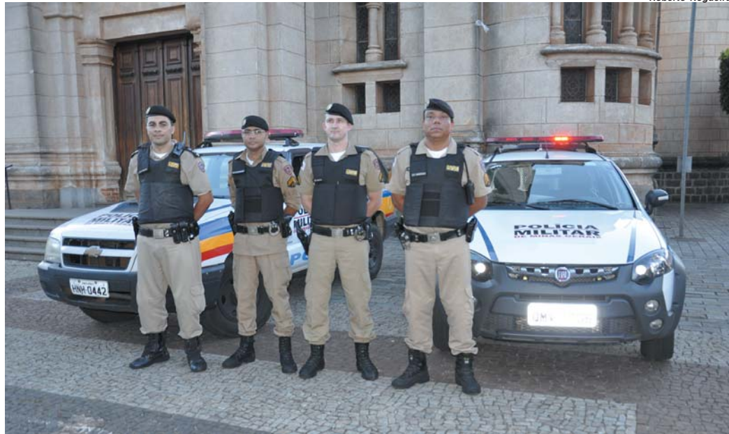
PM inicia operação presença na parte central onde concentra-se maior arte do comércio, consumidores e região bancária

Sicredi promove palestra com Carlos Hilsdorf na próxima semana