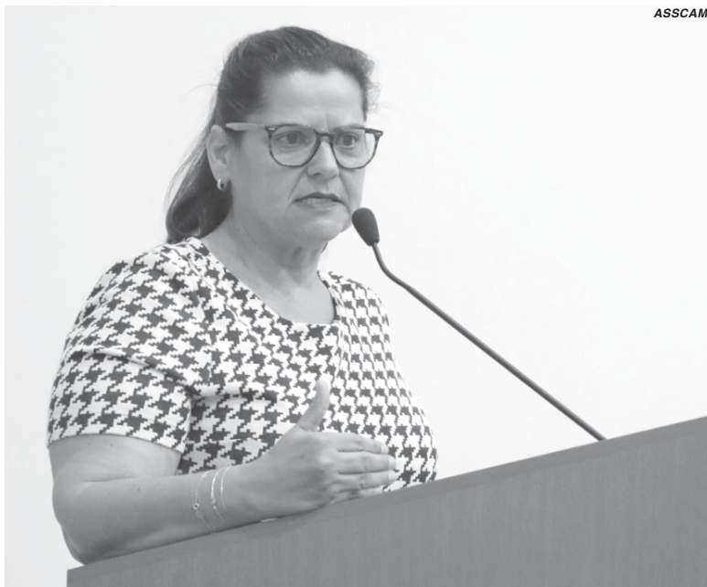
Mãe chorou na tribuna ao relatar que não sabe o que fará no próximo ano com as creches em período parcial

Scarano destacou que jamais falou em quantidade de empregos que a empresa geraria, mas do ICMS - cerca de R$ 60 milhões. Sobre as isenções, a secretária afirmou que não entendeu o pedido, já que o único imposto que a empresa pagaria seria o ICMS, que é um tributo estadual e ITR, que é federal cobrado de imóveis rurais. Ela frisou que não seria cobrado nenhum imposto municipal da empresa a não ser o