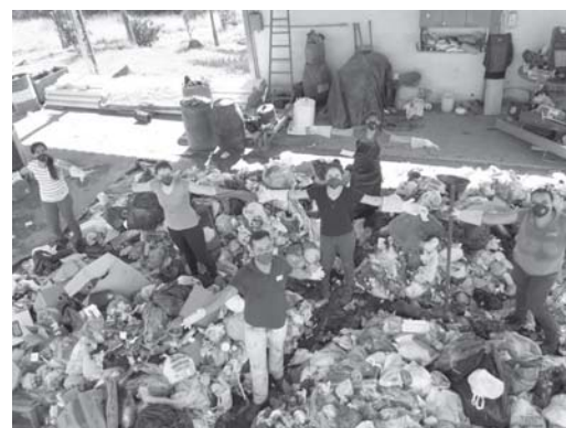
Proposta que será lançada no próximo mês visa ampliar a coleta seletiva em bairros estratégicos do município

A inclusão de Paraíso no programa se deu através do cumprimento das condições