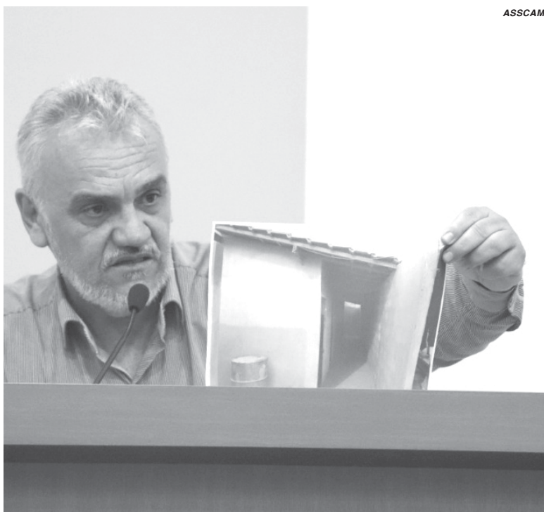
Empresário alega ser dono das terras e que não foi comunicado sobre construção