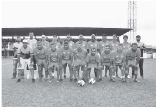
Paraíso Lanches conquistou a vaga na final ao vencer Vila Dalva nos pênaltis