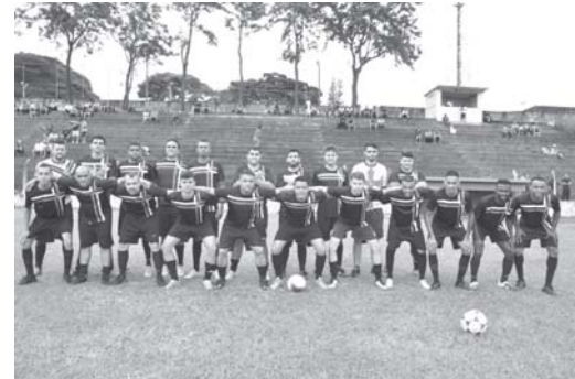
Santa Cruz eliminou o Operário na vitória por 2 a 1, no domingo de manhã

O domingo foi dia de bola rolando na Taça Paraíso 2019 com a realização das duas partidas da fase semifinal da "Série A". Logo pela manhã no Estádio Etori Cantieri, no confronto entre dois alvinegros, o Santa Cruz levou a melhor ao vencer o Operário E.C. por 2 a 1 e tornou-se o primeiro finalista da Primeira Divisão.