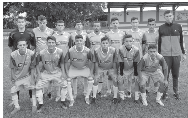
Paraisense Sub-19 vem realizando um trabalho consistente com os frutos já sendo colhidos logo de início

Desde que o trabalho foi iniciado nesta temporada a equipe tem feito bonito nas apresentações em Paraíso e em toda a região. Com uma campanha relevante a Verдона está prestes a conquistar a vaga